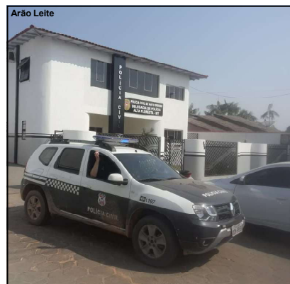
Caso foi encaminhado à Delegacia de Polícia Civil de Alta Floresta para investigação

Suspeito preso negou crime e segundo informações, tentava corrigir jovem de 19 anos