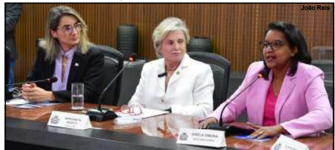
Evento no Palácio Paiaguás com a senadora Margareth Buzetti

A Sefaz ressalta que a migração do banco de dados para novos equipamentos que visa aprimorar o desempenho do banco de dados usado para armazenamento de documentos da secretaria. Além de melhorar o desempenho e a capacidade de armazenamento, a medida visa especialmente dar celeridade ao processo de autorização dos documentos fiscais.