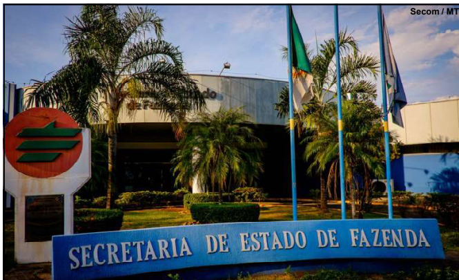
Sefaz deverá fazer atualização do banco de dados

Previsão é de que atualização seja concluída e os sistemas restabelecidos até às 22h do mesmo dia