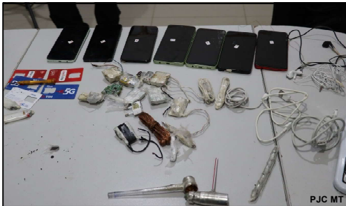
Quantidade de material apreendido pela Polícia Penal

Com o apoio operacional do Grupo de Intervenções Rápidas (GIR) e do