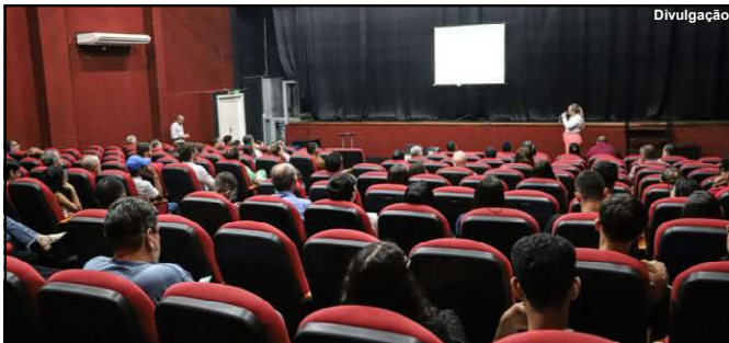
Evento realizado no dia 30 último sobre Gestão Integrada em AF

A indústria é o setor que mais gera riqueza no país. A cada real produzido por ela, são gerados R$ 2,32 para a economia brasileira como um todo, de acordo com cálculos da Confederação Nacional da Indústria (CNI). Levantamento do Observatório da Indústria do Sistema Fiemt mostra que Mato Grosso tem 89 frigoríficos e no país é o estado que mais gera empregos no setor. São 23 mil funcionários, o equivalente a 18% dos mais de 130 mil profissionais que atuam em 1.098 estabelecimentos frigoríficos no Brasil.