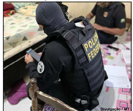
Agentes federais durante operação nesta sexta-feira em MT

As investigações identificaram que o acusado teria criado um perfil com dados falsos em rede social, para realizar a venda de imagens e vídeos contendo abuso sexual infantojuvenil, sendo o pagamento por PIX. A medida cautelar objetiva angariar elementos que contribuam para a instrução da investigação em curso.