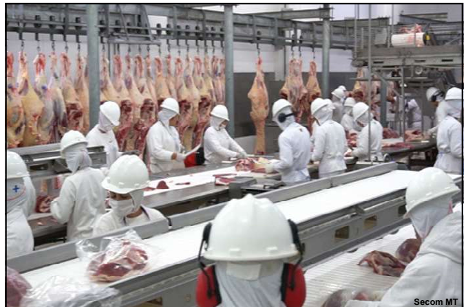
As novas plantas autorizadas estão localizadas em Várzea Grande, Colider, Diamantino, Confresa, Alta Floresta e Pontes e Lacerda