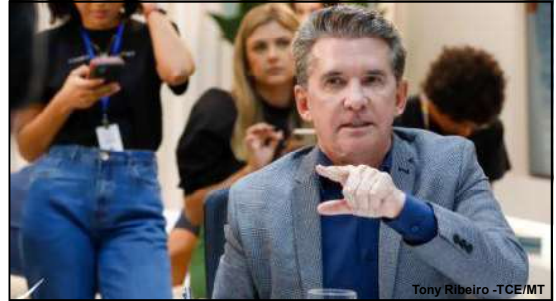
Presidente enfatizou a importância do cumprimento de todos os parâmetros estabelecidos na Resolução Normativa

em único edital e sob gestão da Secretaria de Estado de Infraestrutura e Logística (Sinfra-MT). A medida garante mais concorrência na iniciativa privada, uma vez que o