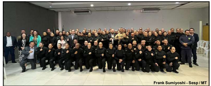
Novos servidores da Polícia Penal em Mato Grosso

Foram formados 79 policiais penais e oito profissionais de nível superior, sendo estes das áreas de psicologia, enfermagem e assistência social.