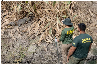
Veterinários que já estão atuando na equipe multidisciplinar especializada da Sema-MT

Ele destaca que quatro médicos veterinários voluntários irão somar a equipe no Pantanal e chegam no final do mês de agosto. "Essa equipe é de Minas Gerais e irá atuar com uma estrutura móvel com ambulatório, equipado de ultrassom, além dos atendimentos clínicos e terapêuticos. Estamos antecipando tudo. Em caso de um desastre ambiental já estamos prevendo várias medidas de resgate. Essa unidade deverá ficar na base do Exército Brasileiro, localizada também na Transpantaneira".