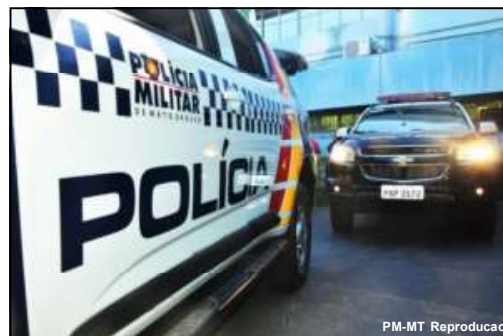
Polícia Militar fazia rondas quando flagrou suspeitas

Com idade de 15 e 17 anos, duas suspeitas foram apreendidas pela PM no domingo, 4