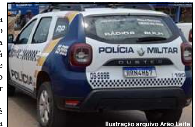
PM foi acionada e prendeu um suspeito

A vítima com ferimento mais grave é o dono do bar que, conforme boletim da PM, se desentendeu com um cliente e depois foi para cima. Durante a briga e confusão com mais pessoas, ele levou duas perfurações de faca na barriga. Um outro homem que tentou intervir também levou um golpe, mas menos grave, no braço. Uma testemunha teria apontado o autor do crime,