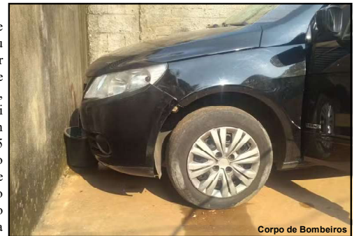
Corpo de Bombeiros

Uma criança de sete anos morreu após ser acidentalmente atropelada pela mãe, que não foi identificada, em Rondonópolis, a 215 km de Cuiabá, no domingo (4). A mãe tentava estacionar o carro em casa, quando prensou a criança contra um muro, segundo a Polícia Militar.