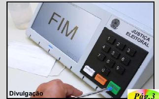
Divulgação Pág. 3