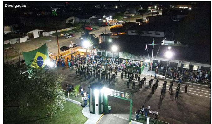
Evento acontecerá na sede do TG em Alta Floresta