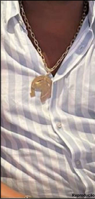
Corrente foi um dos pertences levados da casa de garimpeiro

Revoltado, garimpeiro agradece não ter chegado na hora que a mulher e filha eram torturadas