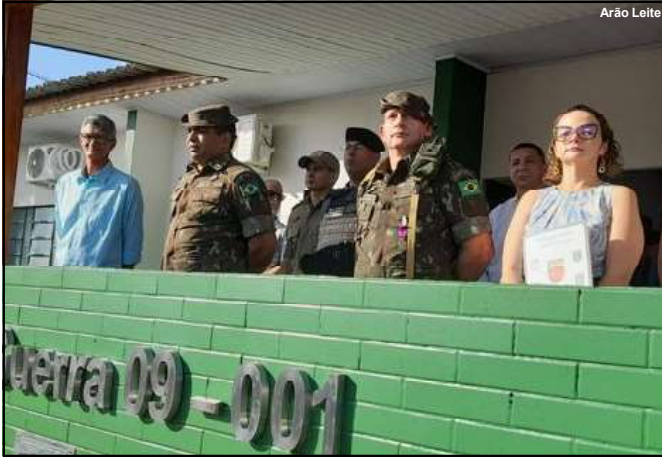
Evento realizado no Tiro de Guerra de Alta Floresta

Autoridades civis e militares prestigiaram momento marcado por formatura do TG