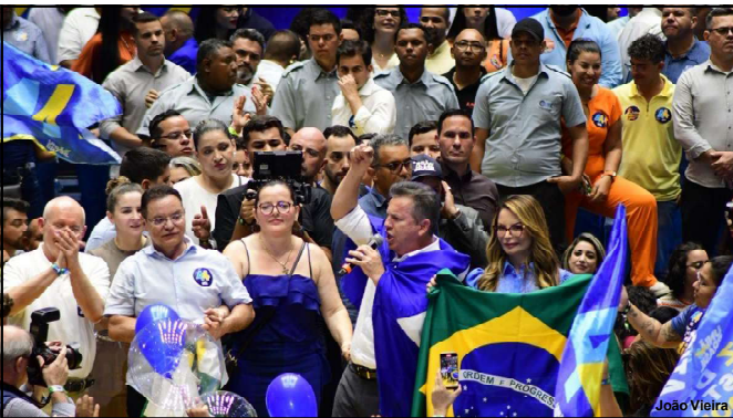
Apoiados pelo governador do estado, líderes políticos buscam conquista da eleição em outubro

E há no município de Alta Floresta quem já printou ou arquivou material de adversários justamente em busca de eliminar concorrência com processo junto à Justiça Eleitoral. A propaganda extemporânea por exemplo é a denúncia preparada por candidatos e partidos na sede da 24ª Zona Eleitoral.