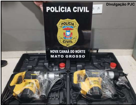
Equipamentos apreendidos com acusados de estelionato em Nova Canaã do Norte

Os dois foram presos durante abordagem na MT-320 em Nova Canaã do Norte