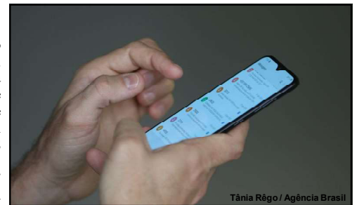
Tânia Rêgo / Agência Brasil

Sem desconfiar, a vítima fez diversas transferências via PIX para contas indicadas pelo golpista. Ao todo, ela transferiu R$ 3.850,00, R$ 6.550,00, R$ 11.200,00 e R$ 4.900,00, todas transferências em nomes de