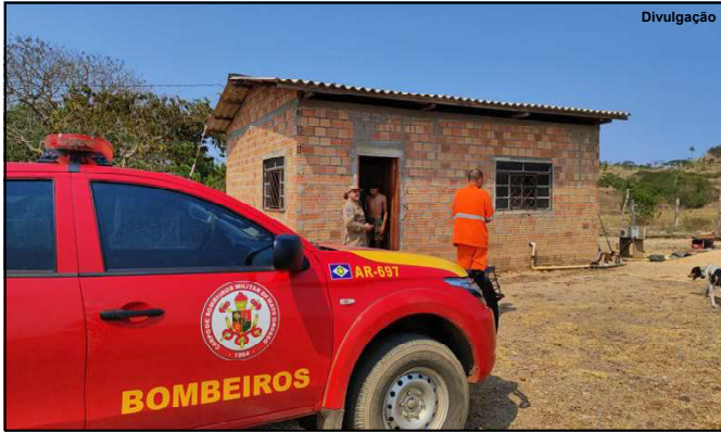
Bombeiros da 7ª CIBM atendendo ocorrência na região