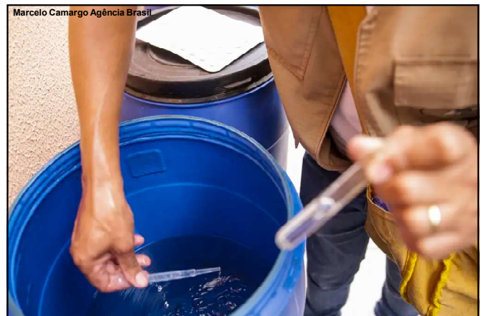
Números preocupam Secretaria de Estado

Ressalta que isso ocorre com uma pequena parcela dos infectados, mas o aumento é motivo de alerta.