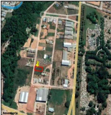
Demanda foi indicada durante sessão em AF