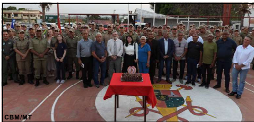
Evento marcado também por muitas homenagens

Evento foi realizado nesta segunda-feira (19) no Quartel do Comando Geral da corporação, em Cuiabá