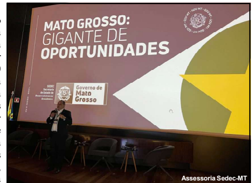
Secretário de estado, Cezar Miranda, em Campo

O Floresta 360° é uma oportunidade para atração de investidores e reforçar o