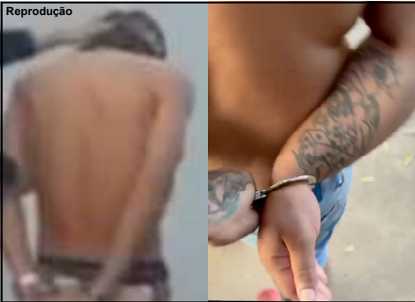
Dois foram presos ontem, mas são três

Operação Alvorada foi deflagrada nesta quarta-feira com prisão dos envolvidos