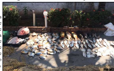
Apreensões feitas em Barão de Melgaço

Os autos de infração e materiais apreendidos ficaram sob responsabilidade da Sema-MT.