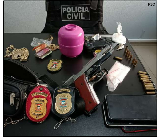
Material apreendido na casa dos suspeitos em AF

Mas um bandido foi preso ainda em flagrante naquela ocasião. Os outros dois fugiram, mas a Polícia Civil, em sigilo e de forma minuciosa investigou o caso que encerrou nesta quarta-feira com a prisão dos demais e apreensão de vários materiais, droga, arma de fogo e produtos pertencentes à uma família do roubo no grande Cidade Alta.