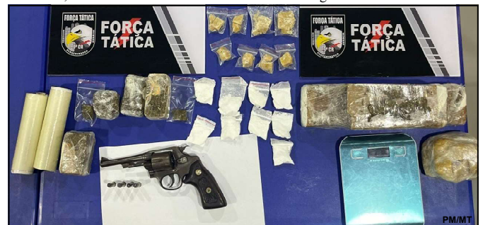
Revólver, maconha, pasta base e cocaína apreendidas em AF

O homem que acabou morrendo, segundo repassou a PM, “possuía passagens criminais por tráfico de drogas, uso ilícito, porte irregular de arma de fogo e conduzir veículo sob efeito de álcool. Os materiais apreendidos foram levados à delegacia.