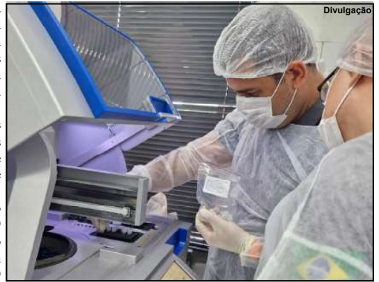
Perícia Oficial de Identificação trabalhando para oficializar nome das vítimas de tragédia

A investigação sobre a causa do acidente está sendo conduzida pelo Serviço Regional de Investigação e Prevenção de Acidentes Aeronáuticos (SERIPA), da Força Aérea Brasileira.