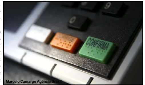
Marcelo Camargo Agência Brasil

Pois é o candidato (no caso o partido) quem escolhe dentre as disponibilizadas na plataforma. Foram totalizados 2.241 candidatos, ou 20,43% do total.