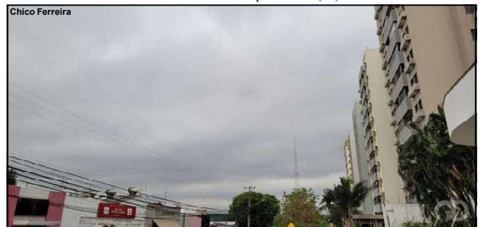
Tempo frio no estado de Mato Grosso essa semana

Sinop (500 km de Cuiabá) a mínima fica entre 17°C e 22°C, segue até a próxima quinta-feira (29). E máxima de 38°C