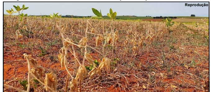
Com prazo de 90 dias, a medida visa à adoção de ações urgentes que possam minimizar os efeitos da estiagem

Entre as medidas, os decretos autorizam as autoridades municipais a convocar e utilizar todos os servidores e equipamentos necessários à execução das ações de resposta à situação de emergência, inclusive, mediante a contratação temporária de pessoal, caso necessário.