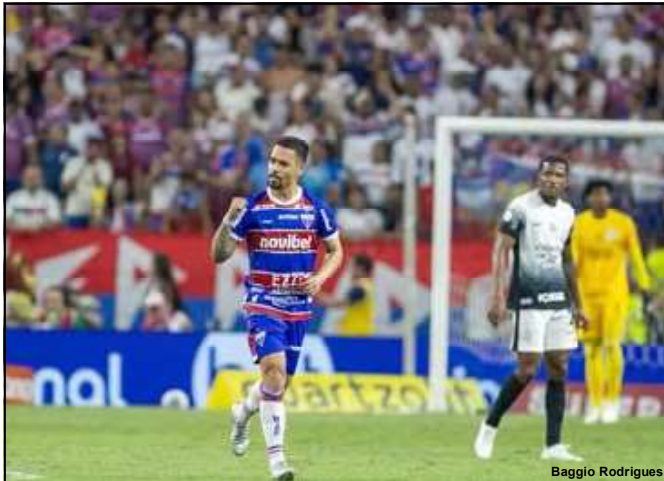
Pikachu fez o gol da vitória diante do Corinthians

Com a derrota o Cuiabá é o penúltimo colocado com apenas 18 pontos conquistados até a 24ª rodada.