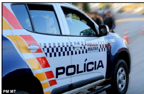
Caso em Apicás registrado pela PM no domingo, dia 25

conhecido e que chegaram quatro homens e se sentaram à mesa junto com a vítima.