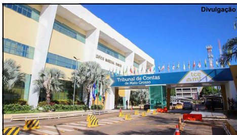
Tribunal de Contas de Mato Grosso