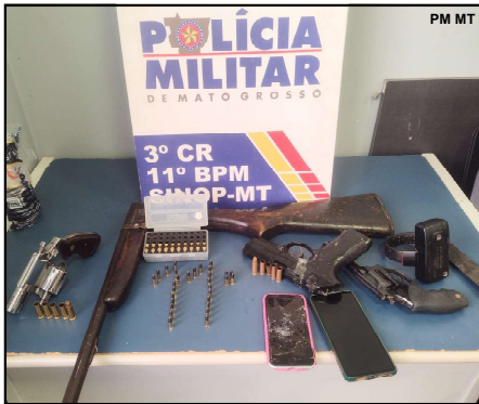
Todo o material apreendido pela PM foi encaminhado à Delegacia de Polícia Civil

Após breve perseguição, o condutor do carro abandonou o veículo e continuou fugindo