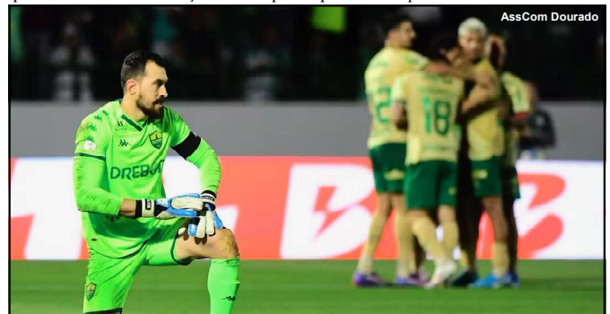
Cuiabá sofreu dura goleada frente ao Palmeiras

EM ALTA FLORESTA, PRECISOU DA POLÍCIA MILITAR, LIGUE: