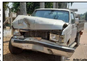
Essa caminhonete estava na preferencial quando carro de motorista bêbado invadiu pista

O choque foi violento e a S-10 foi jogada fora da pista, acertando o muro. O motorista precisou ser retirado do carro pelo lado do passageiro e ao passar pelo teste do bafômetro apontou que estava bêbado. A PM o prendeu