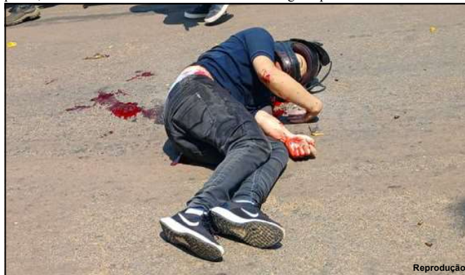
Execução aconteceu no sábado, dia 24 de agosto

20 dias. Ficou cerca de dez meses preso, acusado de envolvimento com o tráfico de drogas. O caso segue investigado pela Polícia Civil.