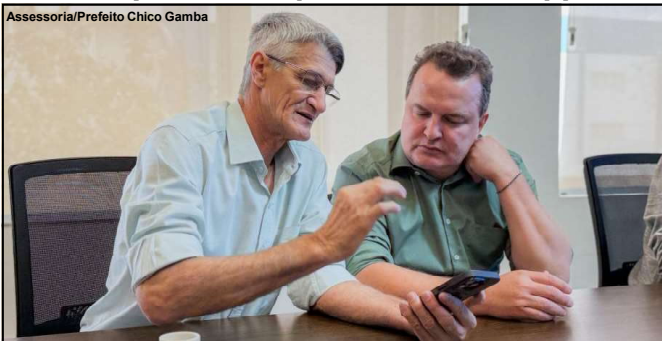
Projeto visa ampliar o atendimento a comunidade escolar

A expectativa é que, nos próximos meses, as licitações sejam lançadas e as obras iniciadas, trazendo mais qualidade e oportunidades para a educação de Alta Floresta.