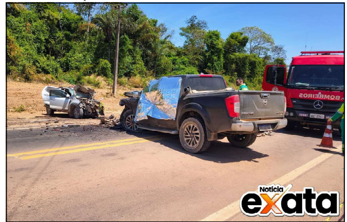
Acidente trágico na MT-208

A expressão encontra paralelo na cultura regional, como a abelha Mandaçaia, cujo nome indígena significa “vigia bonito”, em referência ao papel de guardiã da colmeia.