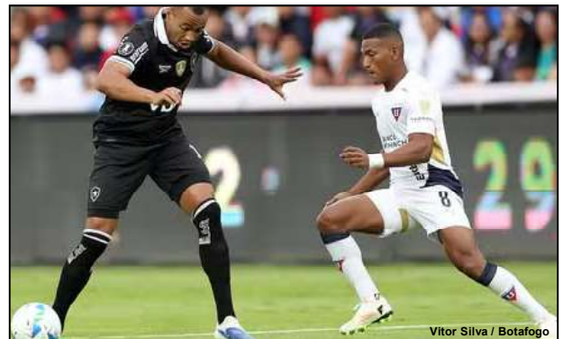
Vitor Silva / Botafogo