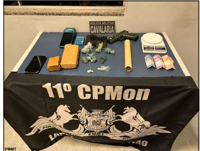
Ação da Cavalaria da Polícia Militar

A operação reforça o empenho da Polícia Civil de Mato Grosso em combater o crime organizado e assegurar a responsabilização penal dos envolvidos em homicídios qualificados.