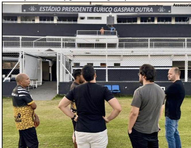
Dutrinha recebe vistoria e está apto para decisão

A diretoria mixtense está fazendo uma grande mobilização de torcedores para apoiar a equipe no jogo que pode dar a vaga nas quartas de final da Série D.