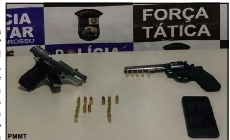
Apreendidas armas e munições ilegais

Em abordagem ao veículo e condutor, os policiais encontraram uma arma de fogo com ele. Questionado sobre o objeto, o suspeito confessou ser dono do material e disse que em sua casa havia outra arma