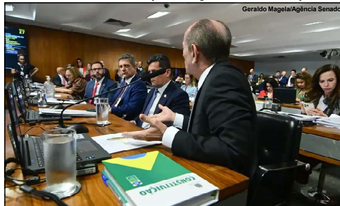
Voto impresso aprovado na CCJ