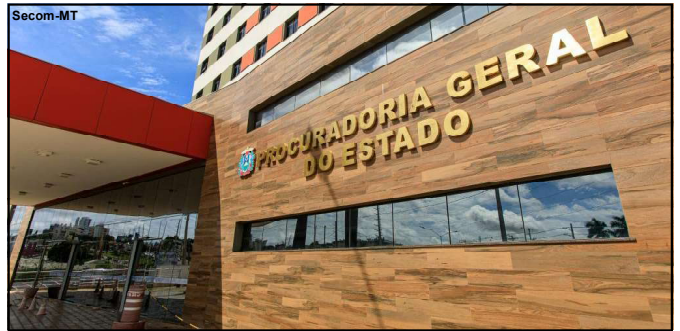
Fundação Carlos Chagas será responsável pelo certame

“São profissionais que têm feito um grande trabalho em Mato Grosso e tornado o nosso sistema prisional um dos melhores do país, reconhecido por ministro do STF e conselheiros do CNJ”, concluiu.