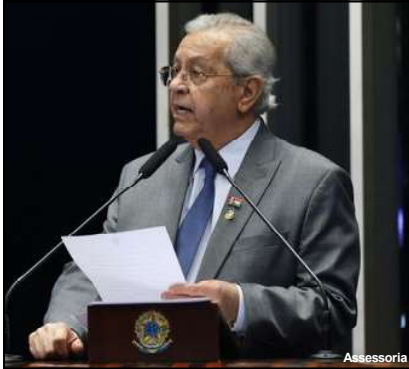
Projetos visam combater a violência contra a mulher

A violência contra a mulher no Brasil tem números considerados alarmantes. Pelo segundo ano consecutivo, Mato Grosso lidera o ranking nacional de feminicídios, um dado que acende um sinal de alerta para a urgência de políticas públicas eficazes. Foi com este cenário de fundo, em face do 'Agosto Lilás', que o senador Jayme Campos (União-MT) usou a tribuna do Senado Federal na noite desta quarta-feira, 20, para fazer um apelo dramático por celeridade legislativa.