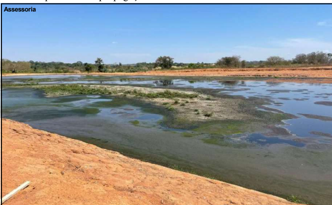
Novas medidas deverão se adotadas

Para descobrir a origem do mau cheiro existente na região, a Sema e as secretarias municipais de meio ambiente de Matupá e Peixoto de Azevedo aplicaram questionário de avaliação de impacto odorante para colher informações junto à população sobre períodos, tipos de incômodos, descrição do odor, grau e, o ponto de vista do entrevistado referente