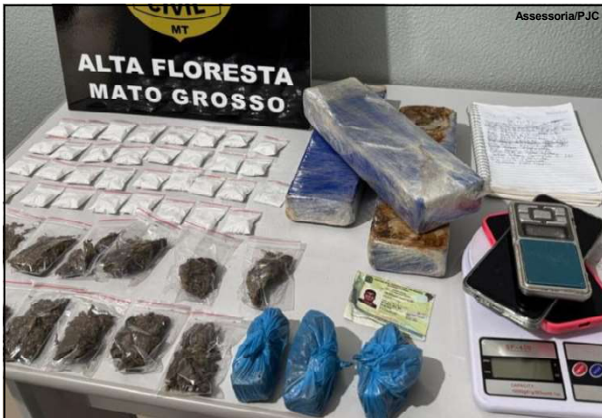
Crime ocorrido em 2024