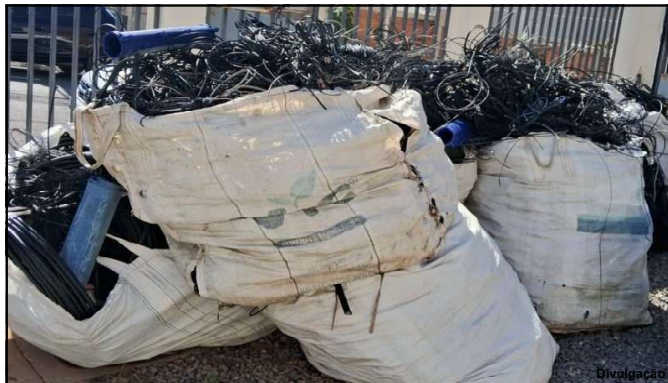
300 quilômetros de fios irregulares das operadoras

A população mato-grossense também pode ajudar a resolver as irregularidades nos postes. Para isso, basta entrar em contato com os canais de atendimento para uma equipe se deslocar e analisar o local para medidas cabíveis.