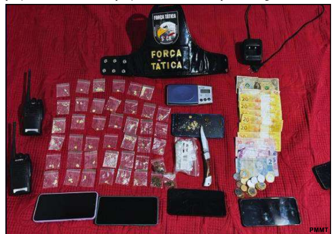
5 conduzidos por tráfico

Na abordagem, foram encontradas duas porções de cocaína e três porções de maconha. A equipe identificou que o adolescente, de 14 anos, possui diversas passagens criminais, como tráfico de drogas, estupro de vulnerável e furto. O menor foi conduzido para a delegacia.