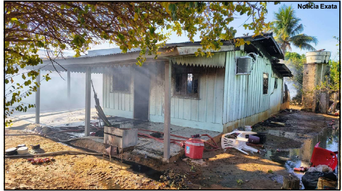
Residência destruída pelo fogo

O Corpo de Bombeiros reforça orientações de segurança em casos de incêndio residencial. Entre elas estão: evitar o uso de instalações elétricas improvisadas, desligar equipamentos da tomada quando não estiverem em uso e, em caso de fumaça ou fogo, sair imediatamente do imóvel e acionar o 193.