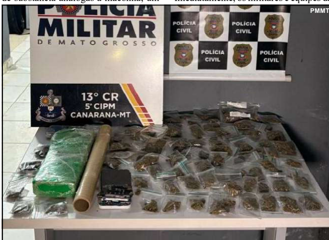
Ação das Polícias Militar e Civil

Além disso, os policiais encontraram um tablete de maconha dentro de um berço, debaixo de algumas roupas. O suspeito e todos os entorpecentes apreendidos foram encaminhados à delegacia para registro do boletim de ocorrência.