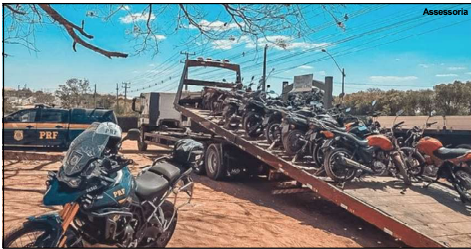
Cavalo de Aço

Além das medidas administrativas, foram registradas seis ocorrências criminais durante a operação, envolvendo como: embriaguez ao volante, dirigir veículo automotor gerando perigo de dano, resistência, desobediência, além de mandados de prisão pelos crimes de homicídio qualificado, furto e uso de falsa identidade.