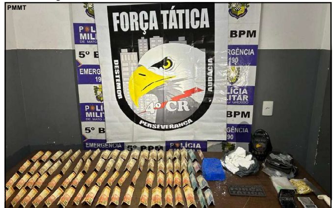
Foragido da justiça de 34 anos pelo crime de homicídio

A sociedade pode contribuir com as ações da Polícia Militar de qualquer cidade do Estado, sem precisar se identificar, por meio do 190 ou 0800.065.3939.