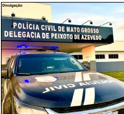
Suspeito de 33 anos preso por violência doméstica