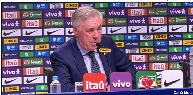
Ancelotti faz sua segunda convocatória

Fora da Copa do Brasil, o Flamengo terá a semana livre para treinar e voltar a campo no domingo contra o Grêmio, às 16h, no Maracanã, pelo Campeonato Brasileiro. No mesmo dia, o Vitória encara o Atlético-MG às 18h30, no Barradão.