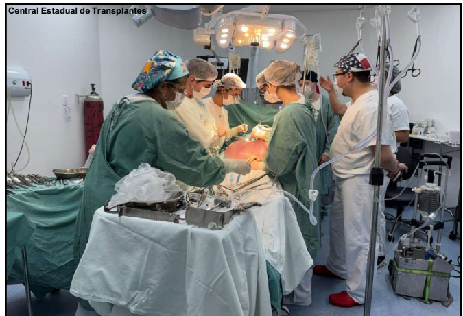
A Central já realizou neste ano a captação de múltiplos órgãos de sete doadores: foram coletados 20 órgãos, sendo cinco fígados, 14 rins e um coração