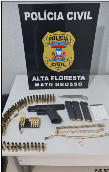
Pistola e munições apreendidas com suspeitos presos em AF

Suspeitos são acusados de cobrança mediante extorsão e podem responder por porte ilegal