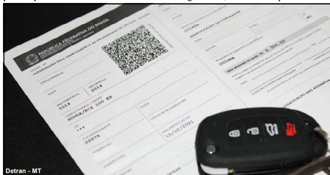
Detran - MT

Conforme dados da Secretaria Adjunta do Tesouro Estadual, da Secretaria de Fazenda do Estado, o total líquido da folha de pagamento é de R$ 698.341.688.