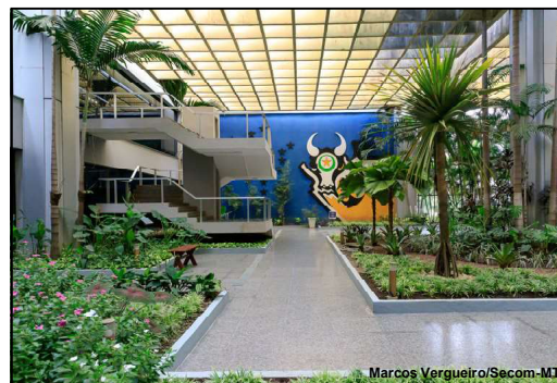
Jardim Palácio Paiaguás

Valor líquido da folha de pagamento é de R$ 689,34 milhões, referente ao mês de julho