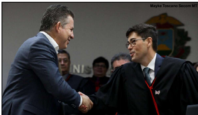
Verba foi repassada para Procuradoria Geral da Justiça