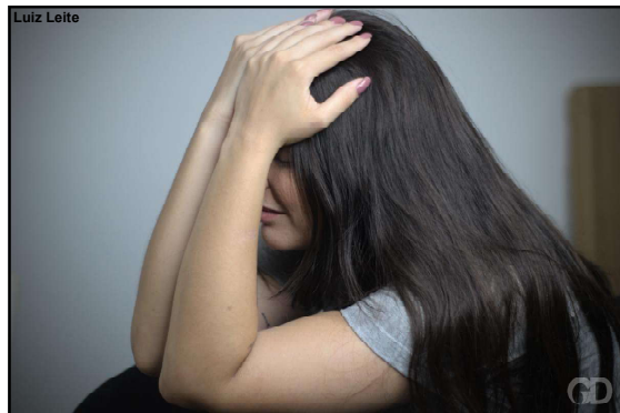
Vítima teve a casa invadida, foi agredida e ameaçada de morte pelo ex