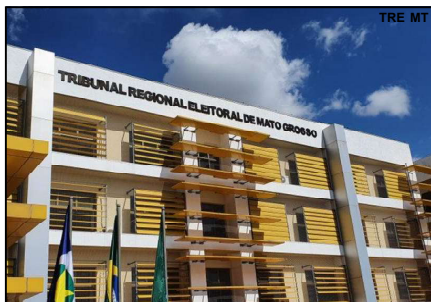
Tribunal Regional Eleitoral de Mato Grosso