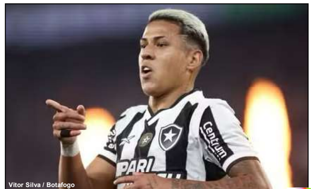
Vitor Silva / Botafogo