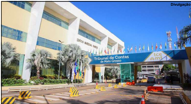
Tribunal de Contas do Estado de Mato Grosso