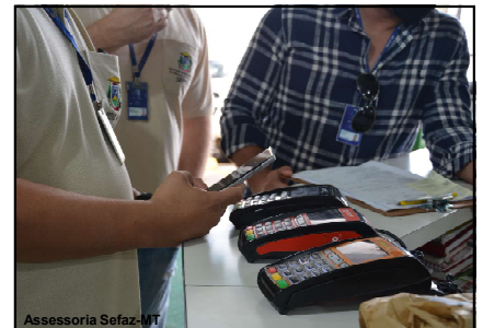
Fiscalização realizada em estabelecimento comercial mato-grossense

No primeiro semestre deste ano, o fisco estadual também implementou 14 novos roteiros de fiscalização, o que contribuiu para a eficácia das ações realizadas. Esses novos