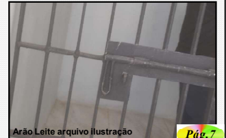
Arão Leite arquivo Ilustração

Homem tinha mandado de prisão em aberto e foi preso pela Polícia Militar