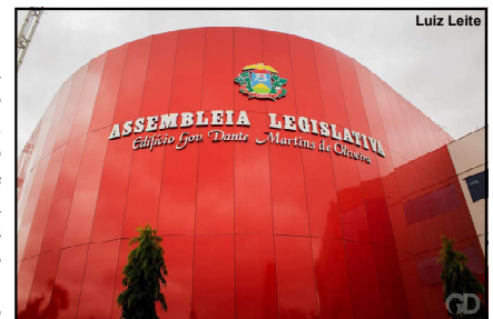
Assembleia Legislativa de Mato Grosso

A lei revogada estabeleceu que, caso solicitado pelo paciente, cuidados íntimos como banhos, troca de fraldas e acompanhamento ao banheiro, devem ser realizados por profissionais de enfermagem do mesmo sexo. O Conselho Federal de Enfermagem (Cofen) e o Conselho Regional de Enfermagem de Mato