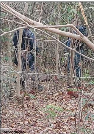
Crime bárbaro é investigado pela Polícia Civil em Nobres

Conforme investigação, pelo menos sete pessoas atuaram no crime