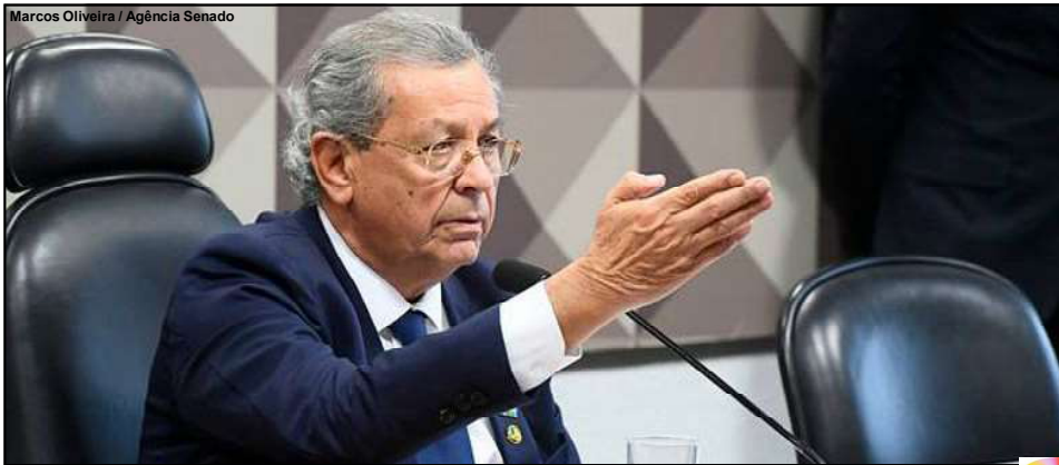
Marcos Oliveira / Agência Senado

“A posse e o porte de armas são mais do que fundamentais na garantia do nosso direito de defesa”, afirmou o senador mato-grossense