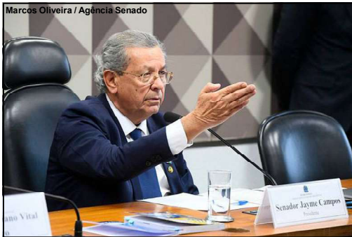
Senador se manifestou favorável a projeto

“A posse e o porte de armas são mais do que fundamentais na garantia do nosso direito de defesa”, afirmou o senador mato-grossense