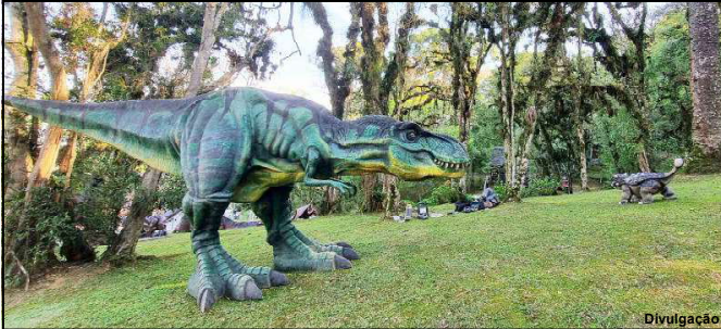
Réplicas ficarão expostas no mês de setembro na Praça da Cultura, em AF

uma delas é acompanhada por um display que apresenta o nome da espécie, a data em que foi encontrada, e outras informações visuais.