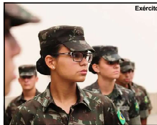
Recrutamento de mulheres será a partir do próximo ano