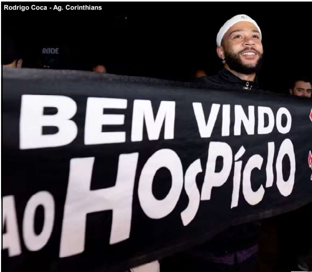
Rodrigo Coca - Ag. Corinthians