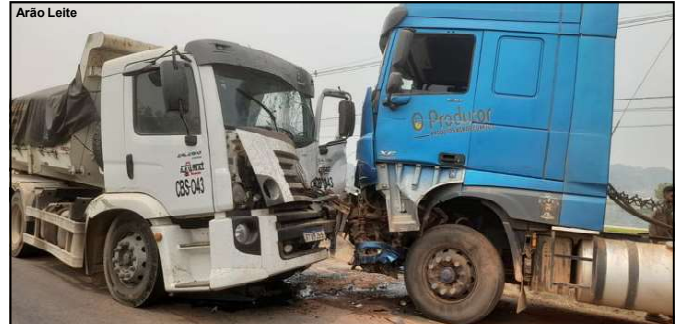
Batida frontal parou trânsito na MT-208 em Alta Floresta

O motorista ferido ficou no hospital e o caso encaminhado à Delegacia de Polícia Civil