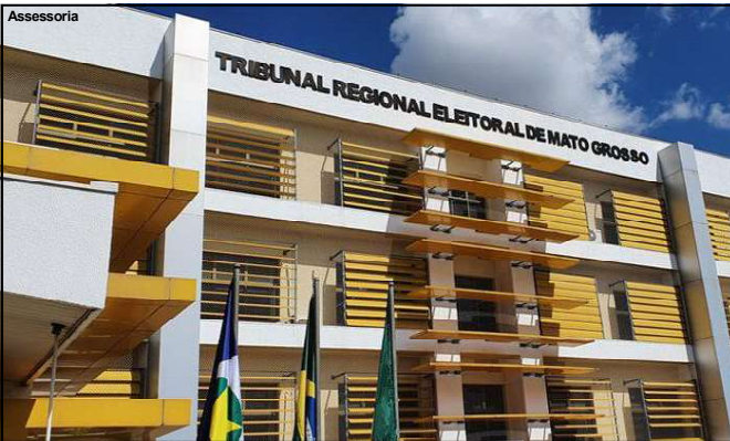
Tribunal Regional Eleitoral de Mato Grosso

Mas os demais consumidores, segundo a mesma nota da concessionária, terão que esperar o cronograma de abastecimento para receber a água potável. Muitos já estão recorrendo a vizinhos com poços artesanais ou mesmo estabelecimentos, garantir ao menos o produto para serviços essenciais como para fazer comida e tomar banho.