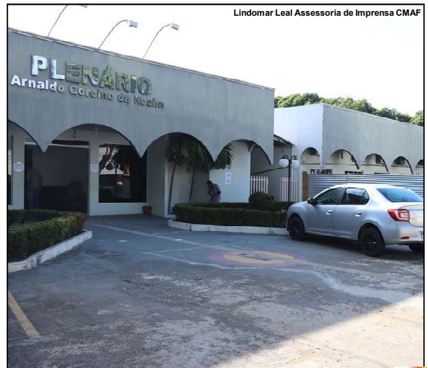
Lindomar Leal Assessoria de Imprensa CMAF