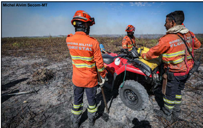
Índice de queimadas em 2024 impacta todo Mato Grosso

Ações de órgãos de segurança no estado são desde janeiro