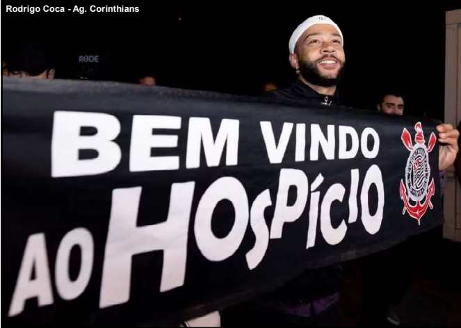
Rodrigo Coca - Ag. Corinthians