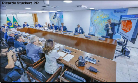
Incêndios florestais tem sido o assunto mais abordado dos últimos dias