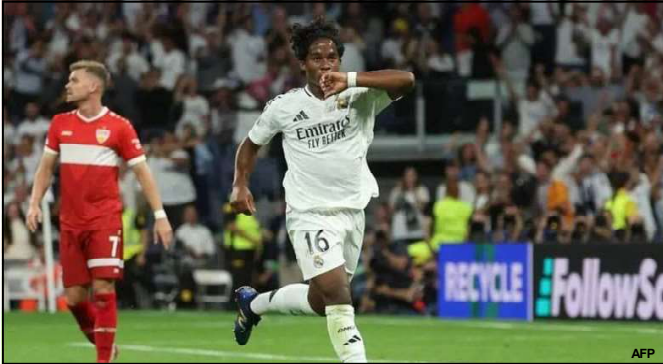
Endrick comemora primeiro gol na Liga dos Campeões