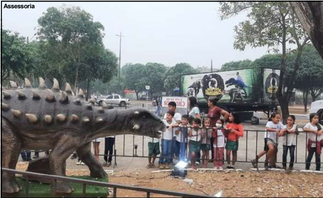
Visita de alunos das escolas de Carlinda nesta quarta-feira pela manhã