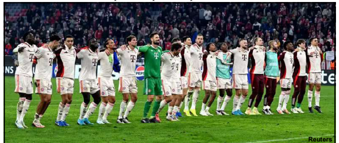
Jogadores do Bayern festejavam goleada na Champions

Essa partida desta terça-feira entre Bayern de Munique e Dinamo Zagreb foi a segunda na história da Champions com 11 gols no total. A outra aconteceu entre Monaco e Deportivo La Coruña, na edição 2003/04, com placar de 8 a 3. Mais gols do que isso, só Borussia Dortmund 8x4 Legia Varsóvia, da temporada 2016/17.