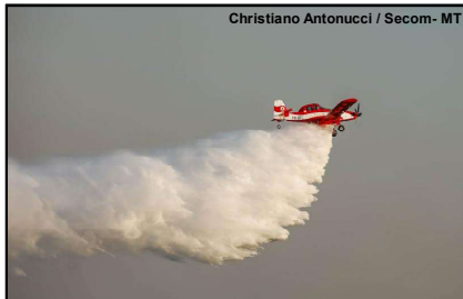
Mato Grosso tenta amenizar impacto das queimadas que continuam no estado

O Governo de Mato Grosso já lançou 3,7 milhões de litros de água com aviões para combater os incêndios florestais no Estado desde o início do período proibitivo. No total, são 736 horas de voo de combate aéreo para proteger o meio ambiente mato-grossense.