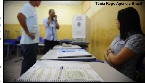
Justiça Eleitoral anuncia número de convocados para atuarem no pleito eleitoral

Em Carlinda foram convocados 93 mesários, sendo 79 como não voluntários e 14 voluntários, já em Paranaíta são 116 pessoas, sendo 93 não voluntárias e 23 voluntárias que irão atuar como mesários e mesárias no atual pleito.