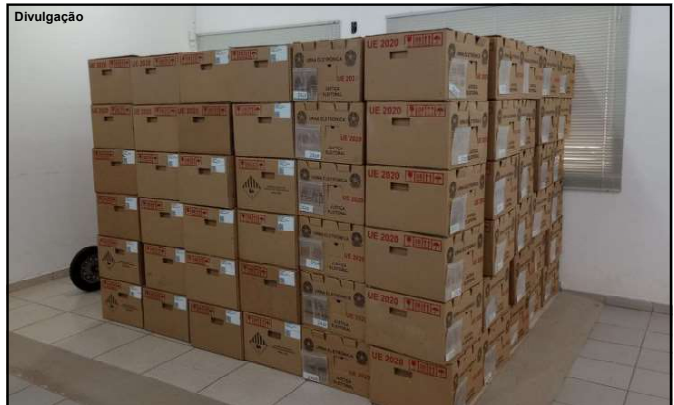
Aparelhos chegam às zonas eleitorais