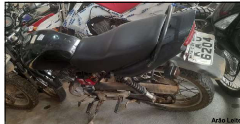
Veículo apreendido foi para o pátio da Delegacia em AF

Jovem de 20 anos foi abordado na noite de domingo no centro da cidade