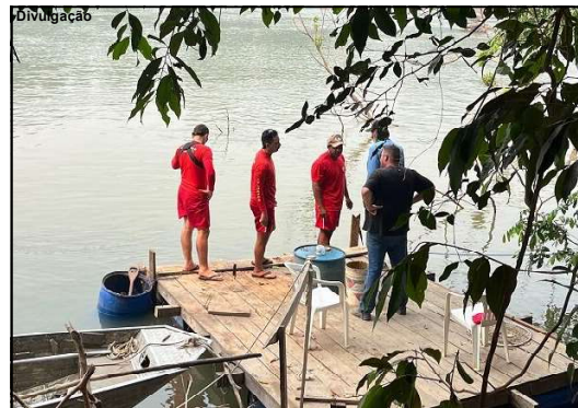
Militares fizeram o resgate na cidade de Sorriso