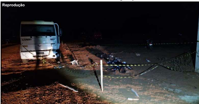
Motoqueiro bateu em caminhão e morreu no local

Não relatos sobre ferimentos ou não do motorista do caminhão. O caso será investigado pela Polícia Civil.