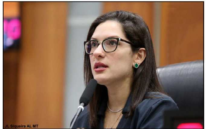
Deputada estadual Janaina Riva

conseguem provar (...). Eu não troquei de lugar com a minha namorada. Ela não bebe, por que é que vou eu dirigir se ela não bebe? Eu posso ter todos os defeitos, mas louco a gente não é".