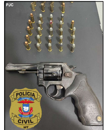
Arma apreendida em Carlinda

Depois de preso e ouvido, o homem ficou em uma cela, à disposição da Justiça.