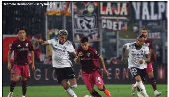
Colo Colo e River Plate decidem vaga na semifinal hoje (24)