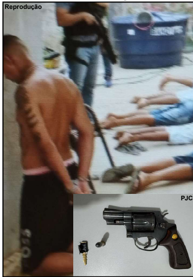
Suspeito de matar motorista de aplicativo foi preso pela Polícia Civil em AF

o motorista que diante da categoria, era um grande trabalhador.