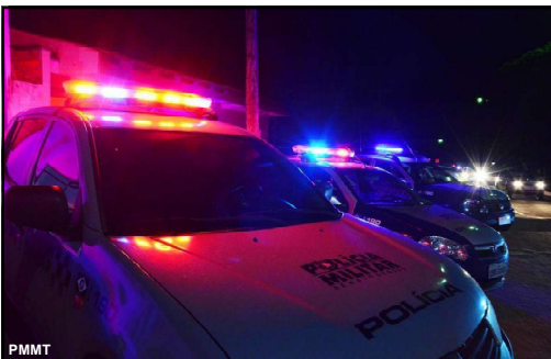
Caso de violência doméstica aconteceu na cidade de Rondonópolis

Suspeito de 37 anos foi preso pela polícia