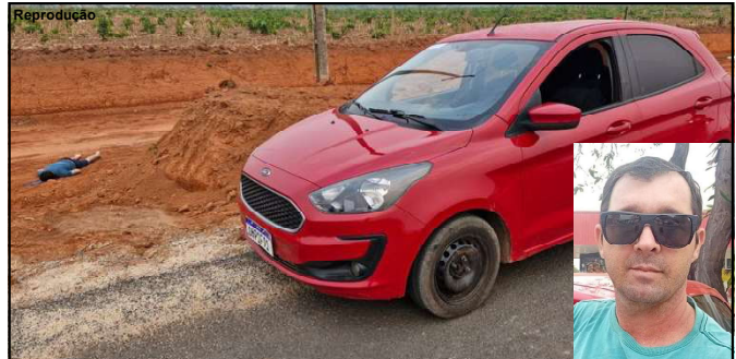
Cenário do crime ocorrido em Alta Floresta. Vítima (detalhe) tinha 45 anos