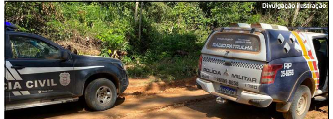
Polícia Civil e PM estão em operação em garimpos de Nova Bandeirantes

dos suspeitos assim como recuperação da caminhonete.