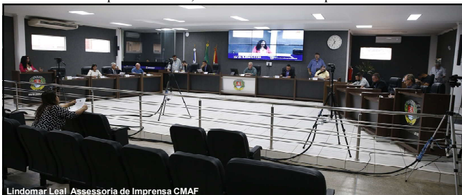
Lindomar Leal Assessoria de Imprensa CMAF

A LDO e todos os seus anexos estão disponíveis para download no site oficial da Câmara Municipal de Alta Floresta.