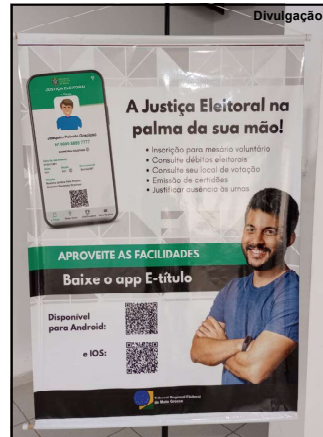
AAPP facilita para o eleitor em qualquer lugar

Um aplicativo que pode ser baixado pelos internautas nos telefones celulares é o E-título, plataforma que