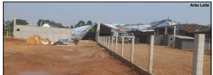
Vendaval destruiu estrutura metálica em Alta Floresta

Coberturas e estruturas metálicas não suportaram força do vento no domingo à noite