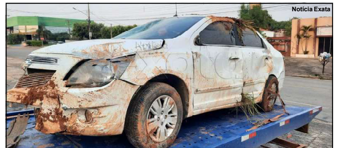
Carro ficou praticamente destruído