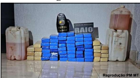
Ação com apreensão de entorpecente foi na MT 100

droga era de outro homem que havia embarcado em um ônibus interestadual rumo a Campo Grande, durante verificações foi constatado ainda que o pai dele foi preso no dia 1 de setembro com 200 quilos de maconha em Ribeirãozinho.