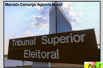
Marcelo Camargo Agência Brasil