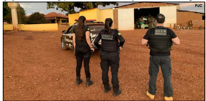
Operação foi deflagrada nesta segunda-feira

“A produção agrícola é o grande motor econômico do Estado de Mato Grosso, o que atrai a atenção de grupos criminosos. Os defensivos agrícolas, por serem insumos de alto valor agregado, fomentam um mercado paralelo ilícito, que depende de um nicho muito específico para dar vazão a mercadoria subtraída. As investigações continuam para identificar outros receptadores, que são os principais fomentadores e pessoas que lucram com esse tipo de crime”, frisou o delegado.