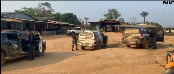
Polícia em operação integrada fez cerco no Garimpo Juruena para prender assaltantes

Polícia ficou quase uma semana fazendo buscas na região onde suspeitos entraram em mata