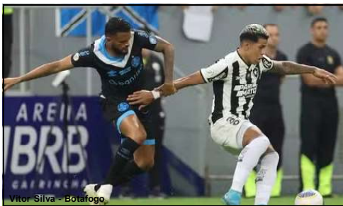
Botafogo 0x0 Grêmio no Mané Garrincha