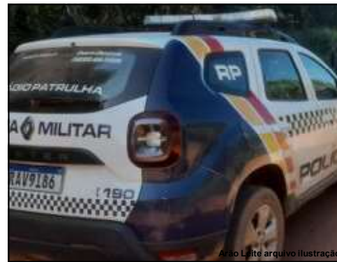
Vítima comunicou fato à Polícia Militar de Alta Floresta

Bandidos ainda torturaram vítima e atiraram contra para-brisa de veículo