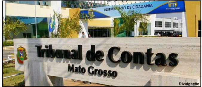
Desentendimento marca processo de concessão de rodovias em MT

Com isso, manteve o conselheiro na relatoria.