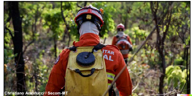
Christiano Antonucci / Secom-MT

Todos os incêndios combatidos pelos militares também são monitorados pelo BEA para orientar as equipes em campo