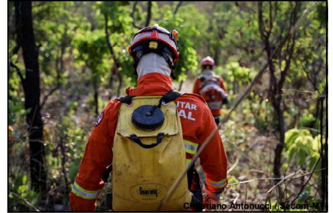
Bombeiros em ações no estado de MT

Desde o início do período proibitivo de uso do fogo, o Corpo de Bombeiros extinguiu mais de 230 incêndios florestais em 60 cidades, sendo elas: Chapada dos Guimarães, Poconé, Cuiabá, Vila Bela da Santíssima Trindade, Nova Lacerda, Barão de Melgaço, Planalto da Serra, Nova Brasilândia, Rosário Oeste, Canarana, Cáceres, Novo Santo Antônio, Peixoto de Azevedo, Marcelândia, Primavera do Leste, Paranaíta, Nova Mutum, Sinop, São José do Rio Claro, Alto Araguaia, Sorriso, Vila Rica, Porto Alegre do Norte, Canabrava do Norte, Itanhangá, Paranatinga, Cláudia, Poxoréu, Pontes e Lacerda, Barra do Garças, Jaciara, Barra do Bugres, Rondonópolis, Lucas do Rio Verde, Tesouro, União do Sul, Alto Garças, Alto Taquari, Nova Maringá, Nova Ubitatã, Nortelândia, Nova Monte Verde,