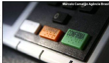
Marcelo Camargo Agência Brasil

Em consulta a Divulgação de Candidaturas e Contas Eleitorais, a candidata não apresentou a sua prestação de contas e consta receitas e despesas zeradas.