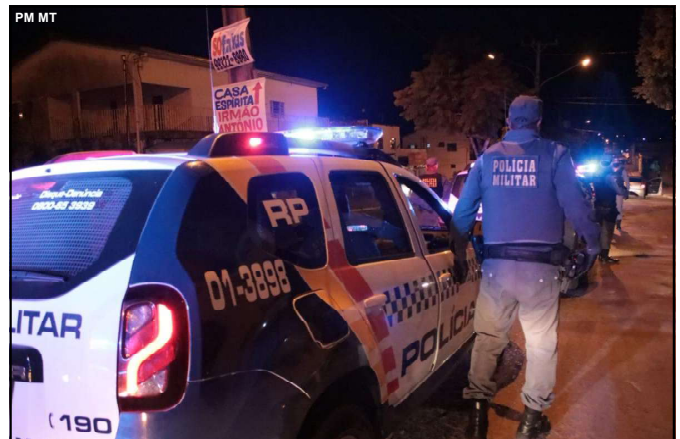
Polícia Militar acionada para atender caso em Juscimeira

Crime aconteceu em estabelecimento comercial na cidade de Juscimeira