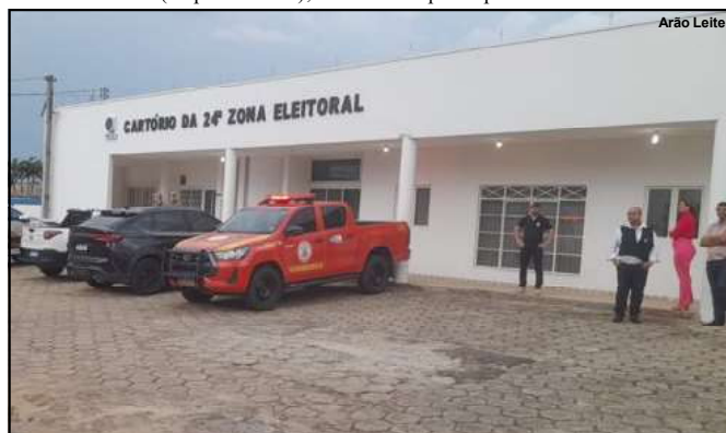
Cartório Eleitoral da 24ª Zona em Alta Floresta oficializou números

Kennedy Henrique (PSD) – 299 votos – 4,97% Solange 10 Irmãos (PSD) – 246 votos – 4,09% Claudinho do Bom Jesus (UNIÃO) – 231 votos – 3,84% Lucia Kanno (PRD) – 225 votos – 3,74% Ticão (UNIÃO) – 217 votos – 3,60% Sandra da Educação (MDB) – 166 votos – 2,76% Lauro Mota (PP) – 154 votos – 2,56% Carlos Malissi (PL) – 153 votos – 2,54% Nelo (MDB) – 149 votos – 2,47%.