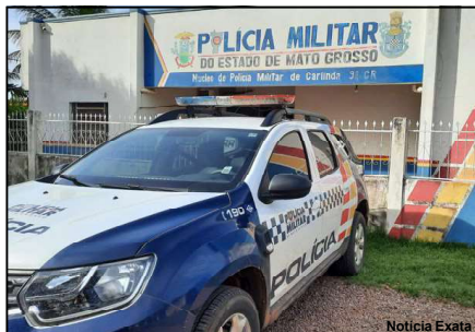
Caso registrado pela PM no domingo de eleições

Em certo momento, os chamaram até um veículo Corsa, de cor prata e mostraram duas espingardas aparentando