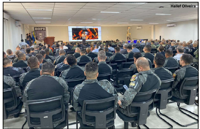
Mais um investimento para qualificação dos policiais do estado

Grosso foi realizado no ano de 2009 e a edição mais recente foi finalizada no ano de 2022. Desde então, nas quatro edições realizadas, 30 militares da PM de Mato Grosso e dos Estados do Acre, Rondônia, Pará, Mato Grosso do Sul e do Distrito Federal foram formados no curso.