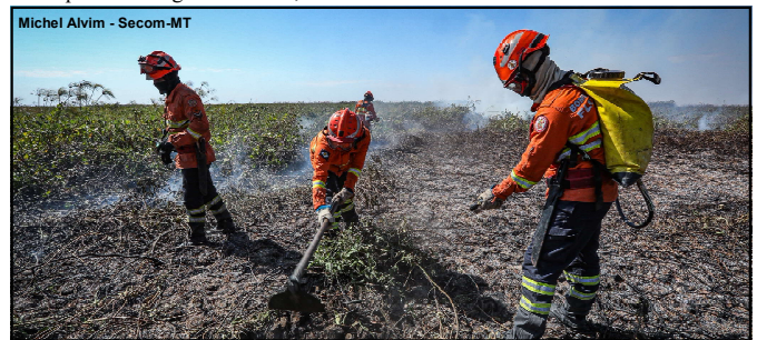
Bombeiros Militares de Mato Grosso em ações de combate

O uso irregular do fogo durante o período proibitivo é crime, conforme prevê a Lei Federal de Crimes Ambientais e, neste ano, mais de 20 pessoas já foram presas e 112 foram indiciadas pela Polícia Judiciária Civil. Além disso, somente neste ano o Governo de Mato Grosso já aplicou mais de R$ 80 milhões em multas.