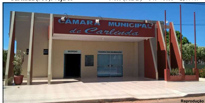
Poder Legislativo do município de Carlinda