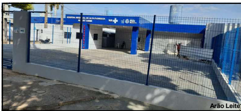
Homem foi agredido e precisou de socorro médico

Polícia Militar e Corpo de Bombeiros foram acionados e homem precisou ser hospitalizado