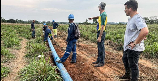
Prefeito acompanha e fiscaliza obra de concessionária em parceria com município