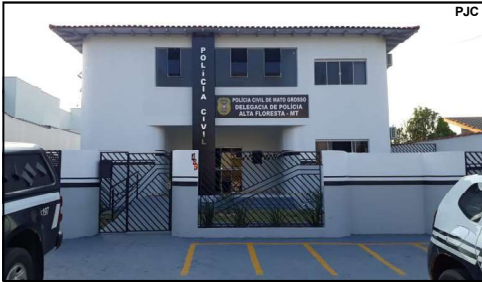
Investigação encontrou idoso no Espírito Santo

Diante das informações apuradas, foi solicitado apoio da Guarda Municipal de Vila