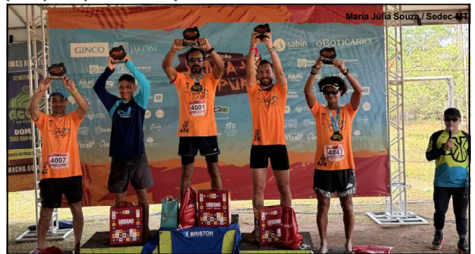
Competição movimentou economia da cidade durante o final de semana; Sedec divulga destinos turísticos de Mato Grosso

“Todo dia sai uma notícia que tem conta bloqueada, que tem problema com patrocinador, e está contratando jogador de seleção. Isso é ridículo. Isso precisa parar”, disse o presidente do Cuiabá.