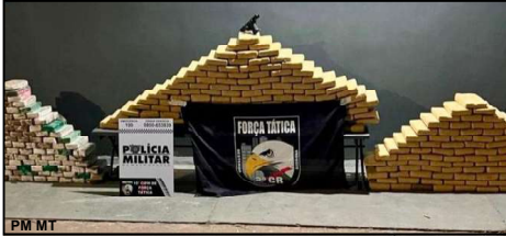
Cerco ao tráfico em MT é cada vez maior

A Polícia Militar de Mato Grosso registrou um aumento de 204% no número de apreensão de drogas em setembro deste ano, com relação ao mesmo mês no ano anterior. Em 2024, as forças de segurança do Estado apreenderam quase 900