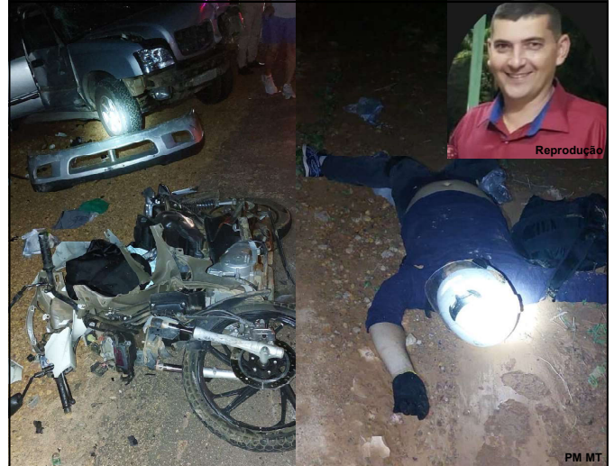
Moto destruída ao se colidida por caminhonete

O motorista e mais uma pessoa ocupante da caminhonete teriam reclamado dores pelo corpo e também foram socorridos. A caminhonete ficou com danos de grande monta na frente e lateral direita. A moto ficou totalmente destruída e o animal de grande porte não resistiu ao atropelamento, ficando morto no meio da