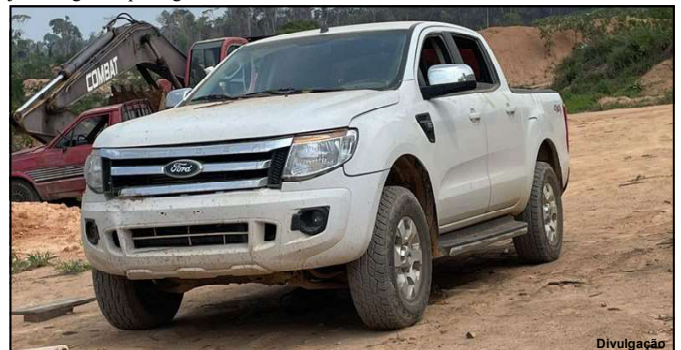
Veículo foi recuperado no domingo, 13 de outubro

O caso segue investigado pela Polícia Civil de Nova Bandeirantes.