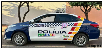
Viaturas serão destinadas para ações de defesa da mulher e contra a violência doméstica

As quatro viaturas são para atuação em Cuiabá e Várzea Grande, sendo duas viaturas para a Polícia Judiciária Civil, para as delegacias de Defesa da Mulher, e as outras duas para a Polícia Militar reforçar