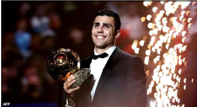
Rodri vence a Bola de Ouro

Perguntado sobre os concorrentes, em especial Vinicius Junior e Bellingham, que formaram o Top-3, Rodri evitou comparações e agradeceu a quem o escolheu. É a primeira vez que um jogador do Manchester City leva o prêmio em uma premiação que deixou o mundo do futebol com opiniões bem divididas.