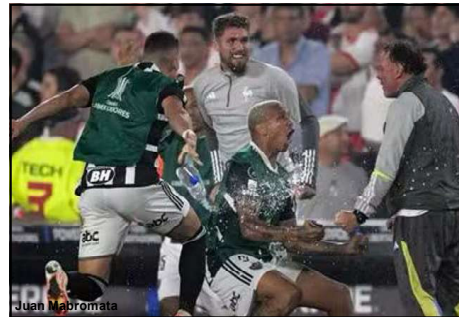
Jogadores do Galo comemoram classificação