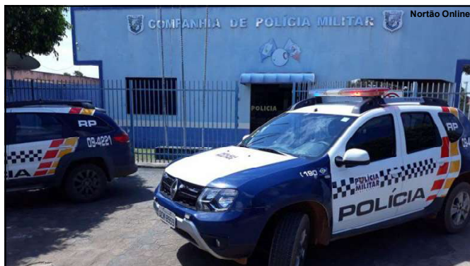
Caso foi registrado pela Companhia da PM em Colíder