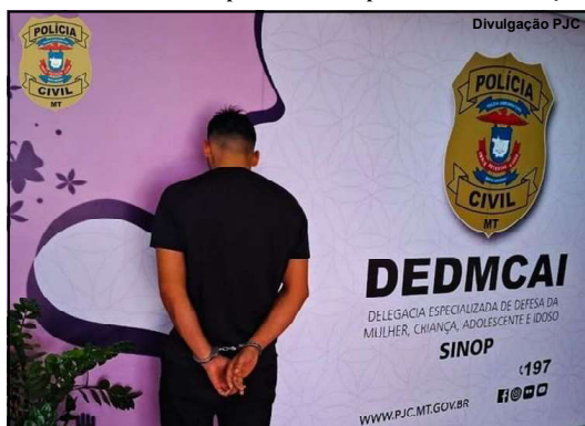
Foragido de Alta Floresta preso na cidade de Sinop

Polícia Civil cumpre mandado após localizar endereço do foragido