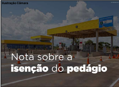
Câmara de Alta Floresta se manifesta

Alta Floresta – Essa semana produtores rurais, moradores de Alta Floresta nas vicinais terceira e quarta Leste, além do Setor Ramal do Mogno, foram surpreendidos com uma decisão judicial que ‘derrubou’ um acordo feito em 2020 quando a Justiça lhes garantiu o direito de isenção