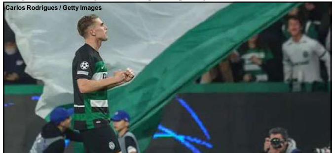
Gyökeres marcou um hat-trick frente ao City

Viktor Gyökeres é o nome do Sporting e foi o nome do jogo contra o City. O sueco teve uma chance de empatar desperdiçada cinco minutos depois do gol de Foden, mas errou na força da cavadinha e deu nas mãos de Ederson. Depois, só deu ele. O camisa nove marcou o primeiro na reta final do primeiro tempo. Ele ainda fez o terceiro e o quarto de pênalti. Além de ter salvado uma finalização de Haaland em cima da linha. Não é à toa que Gyökeres é o maior artilheiro da Europa na temporada 2024/25, com 27 gols em 20 jogos, somando partidas pela seleção da Suécia e pelo Sporting.