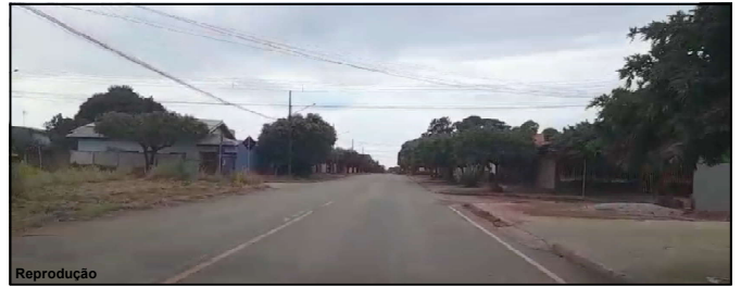
Fato ocorreu no bairro Jardim Universitário em Alta Floresta

Câmera de segurança registrou elemento praticando crime ao amanhecer do dia