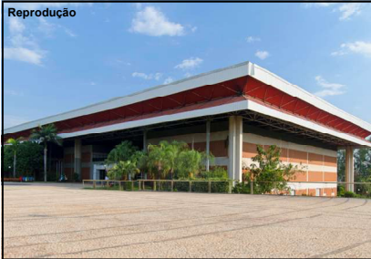
2ª Expominério deve reunir cerca de 5 mil pessoas em três dias no Centro de Eventos do Pantanal

Evento é um dos maiores da mineração no Centro-Oeste e deve ocorrer de 7 a 9 de novembro