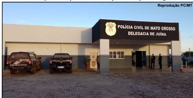
Crime foi praticado em 1995 em garimpo na região de Juína

A FICCO-MT é uma força integrada composta pela Polícia Federal, Polícia Rodoviária Federal, Polícia Civil e Polícia Militar e tem por objetivo a atuação conjunta no combate ao crime organizado no Estado do Mato Grosso.