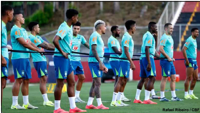
Seleção Brasileira treinou no Barradão

Com 17 pontos, o Brasil é o quarto colocado nas eliminatórias sul-americanas para a Copa de 2026, atrás de Argentina (22), Uruguai (19) e Colômbia (19). O confronto com a Celeste acontece na terça-feira, às 21h45 (de Brasília), na Fonte Nova, em Salvador, pela 12ª rodada.