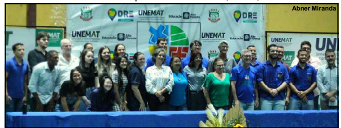
Premiação da competição em Alta Floresta

O projeto de extensão começou em 2019, por meio de um edital conjunto com a Associação Olimpíada Brasileira de Matemática (AOBM).