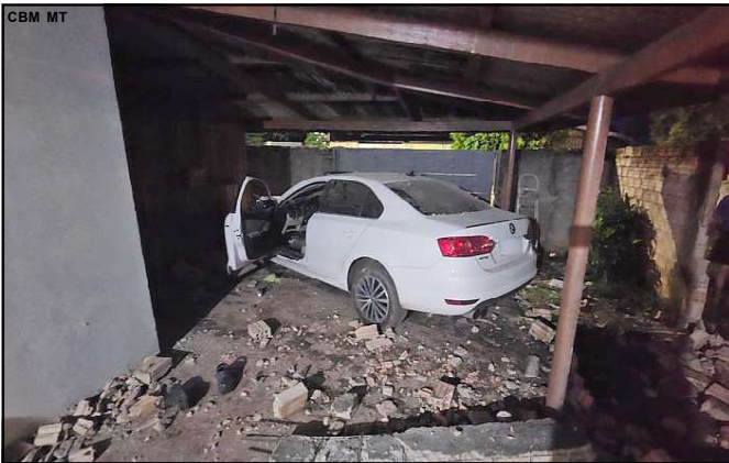
Casa Invadida por carro em AF

O motorista foi preso pela PM e o teste de alcoolemia comprou que ele estava bêbado.