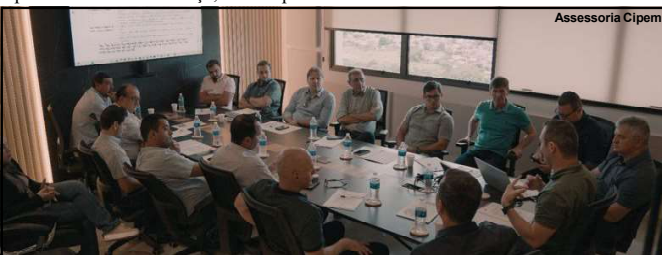
Reunião com diretores do Cipem

Outra novidade relevante para o setor é a ação da FIEMT de criar uma cesta composta por 150 produtos representativos de diversas indústrias mato-grossenses. A iniciativa tem como objetivo divulgar a diversidade e a qualidade dos produtos fabricados no Estado, enviando as cestas para parlamentares estaduais e federais, como também demais instituições em Brasília, além de outros destinatários de destaque. Essa estratégia visa fortalecer a visibilidade e a competitividade das indústrias locais no mercado nacional.