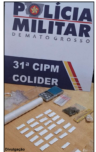
Droga apreendida em Boca de Fumo de Colíder

Na Avenida Governador Jayme Campos uma outra casa também suspeita de base para o tráfico de drogas. Nessa o morador foi encontrado e abordado. Ficou nervoso e não conseguiu negar que no local estava