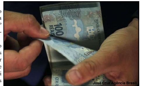
Injeção de valores deve aquecer economia no país

Trabalhadores com carteira assinada e servidores públicos, conforme garante a Constituição Federal; Aposentados e pensionistas do Instituto