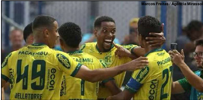
Jogadores do Mirassol comemoram gol do acesso

Palmeiras x Botafogo, terça-feira às 20:30 (horário local) no Allianz Parque.