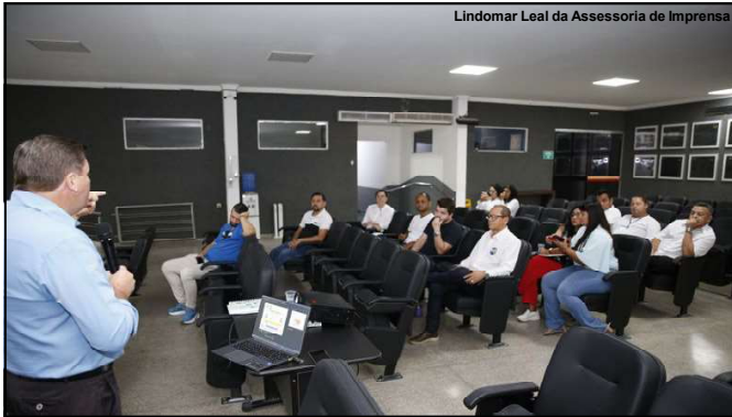
Lindomar Leal da Assessoria de Imprensa

A ação foi uma excelente oportunidade para sensibilizar sobre a necessidade de adoção de hábitos saudáveis, a realização de exames preventivos e o fortalecimento da luta contra o câncer de próstata.