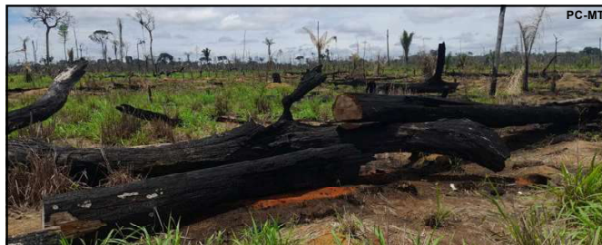
Operação identifica crimes ambientais no noroeste do estado

Equipes vistoriaram as áreas rurais localizadas nos municípios de Colniza, Aripuanã e Juína