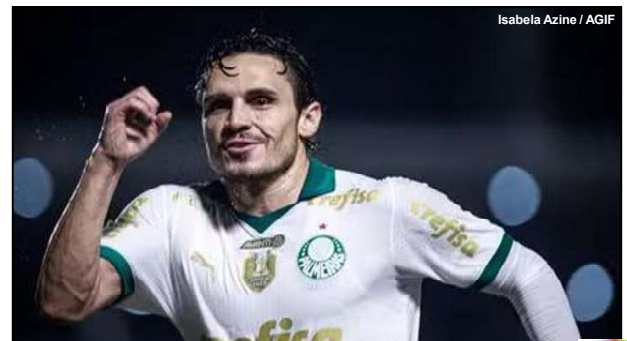
Isabela Azine / AGIF

Clássico deve apontar possível campeão do Brasileiro 2024