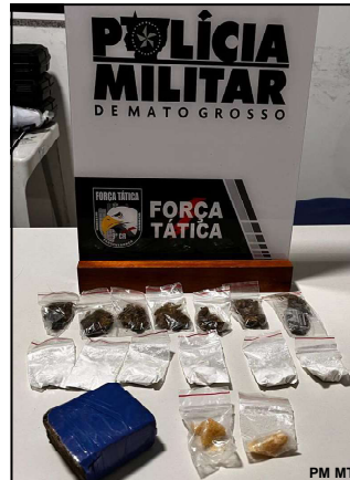
Droga apreendida em ação da PM no Flamboyant em AF

Caso foi no final de semana, envolvendo várias viaturas em cerco policial