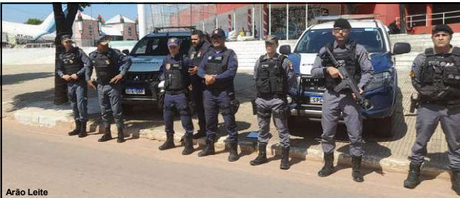
Comando regional reforça policiamento nas ruas de Alta Floresta

O homem acabou sendo detido e encaminhado à Polícia Civil.