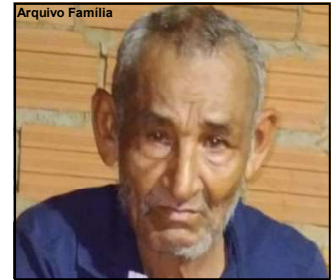
Idoso foi vítima de atropelamento em AF

O caso é investigado pela Polícia Civil que deverá apurar qual modelo de veículo o atropelou e porque o motorista não prestou socorro.