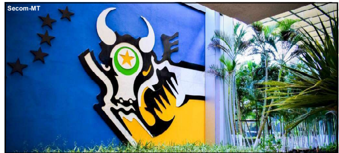
Comitê criado pelo estado faz parte do Programa Tolerância Zero

Comitê vai ser composto pelo governador e representantes das forças de segurança e outros Poderes