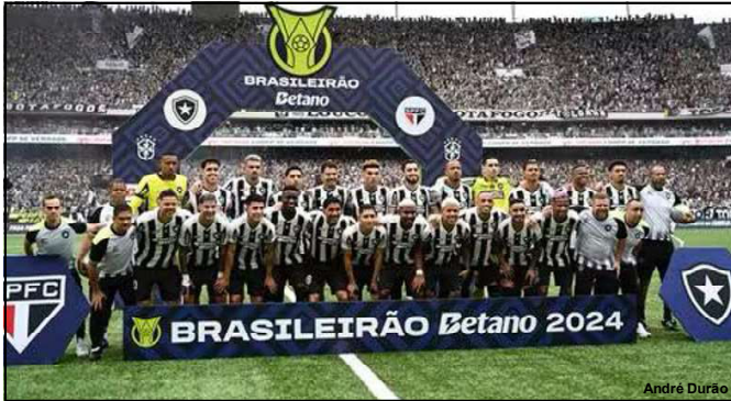
Elenco campeão da Série A de 2024

O adversário na disputa pela taça será o Flamengo, campeão da Copa do Brasil. O jogo será no dia 2 de fevereiro, no Mangueirão, em Belém.