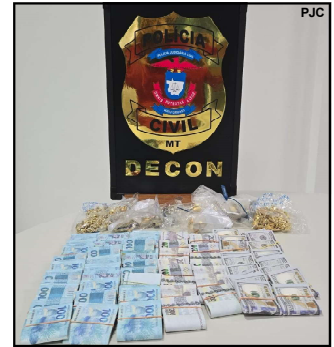
Dinheiro apreendido pela DECON em Mato Grosso

Os consumidores que se sentirem lesados podem registrar boletim de ocorrência em qualquer Delegacia de Polícia, procurar a Delegacia Especializada de Defesa do Consumidor (Rua Gen. Otavio Neves, nº 69, Duque de Caxias I, em Cuiabá), de segunda a sexta-feira durante o horário comercial, ou realizar as suas denúncias, inclusive anônimas, por meio do e-mail: decon@pjc.mt.gov.br , da Delegacia Virtual: https://portal.sesp.mt.gov.br/delegacia-web/pages/home.seam ou no telefone 197 da Polícia Civil.