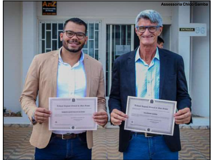
Diplomados, eleitos para a administração de Alta Floresta agora aguardando a posse em janeiro

políticas públicas que possam contribuir para esse desenvolvimento”, finaliza.