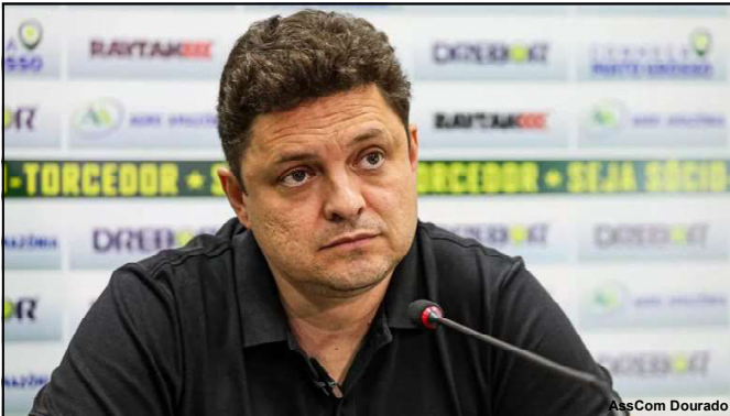
Cristiano Dresch, presidente do Cuiabá E.C

O Cuiabá defenderá o título Mato-Grossense e disputará a Copa do Brasil e a Série B do Brasileiro em 2025.