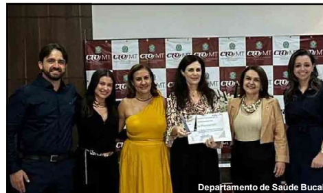
Premiação foi recebida no dia 9 de dezembro em Cuiabá