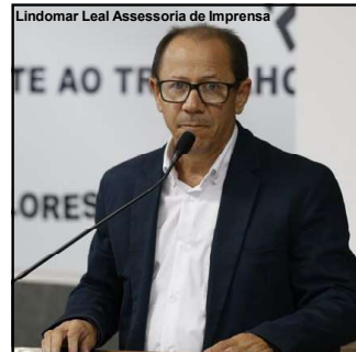
Adelson destaca ações durante mandato

convidando a sociedade a participar mais ativamente das sessões da Câmara. “Quem quiser participar das sessões, venha. Não venham apenas em sessões solenes, que são importantes, mas todos devem ter voz. Somos eleitos por vocês, e participando ativamente, vocês podem nos cobrar. Estamos à disposição”, afirmou.