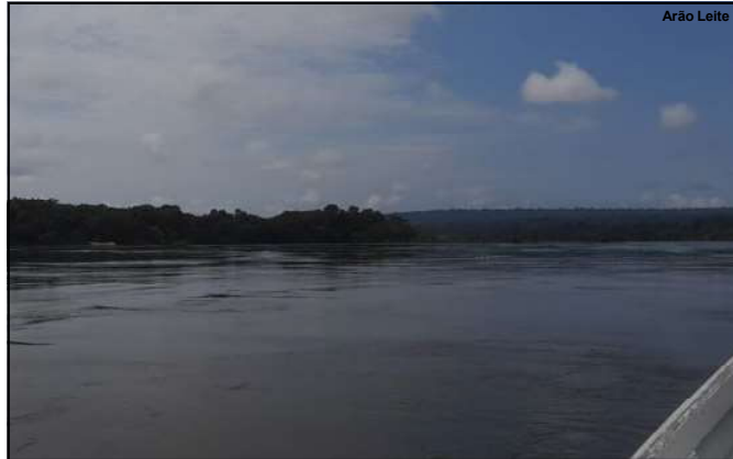
Rio Teles Pires em Alta Floresta será grande palco de Festival de Pesca início do ano

De acordo com a coordenação do setor de Saúde Bucal, o índice de cárie no município diminuiu, saindo de 5.71%, em 1997, para 2.01%, em 2023. Em 2024, foi registrado até o mês de novembro, os números da Saúde Bucal são expressivos, sendo 29.699 pacientes atendidos, 73.960 procedimentos individuais, 24.870 procedimentos coletivos, 7.148 aplicações de flúor, 7.417 escovações supervisionadas e 130 palestras.