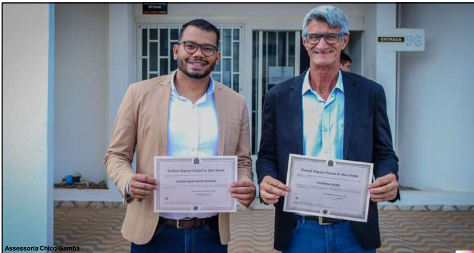
Assessoria Chico Gamba