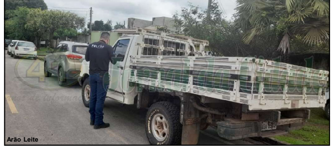
Caminhonete envolvida em acidente fatal foi periciada pela Politec em AF

O veículo foi periciado na terça-feira, mesmo dia em que o motorista se apresentou acompanhado de seu advogado. O caso agora está à disposição da Justiça.