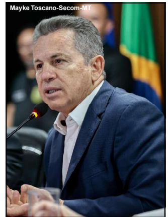
Conforme Mauro Mendes, a proposta visa promover eficiência nos órgãos do estado

A exceção, conforme a proposição, só ocorrerá nos casos em que a falha ou demora na prestação do serviço ocorrer de “caso