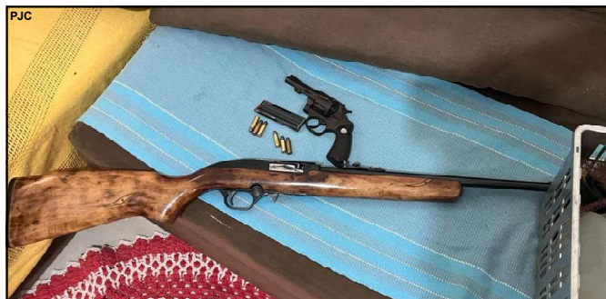
Durante cumprimento da prisão foram encontradas duas armas de fogo

Homem de 54 anos teve prisão decretada por tentativa de homicídio