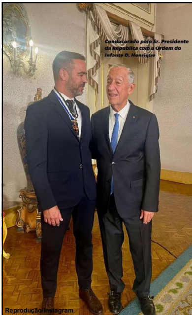
Condecorado pelo Sr. Presidente da República com a Ordem do Infante D. Henrique