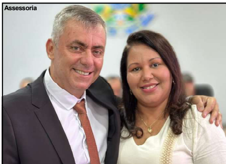
Administrador foi reeleito com 91% dos votos