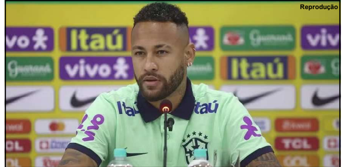
Mas Neymar que já tem 32 anos, diz que fará de tudo para conquista

Arábia. Mas a gente não sabe, o futebol está cheio de surpresas”, concluiu.