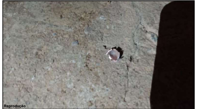
Reprodução Marca deixada por disparo em residência de fiscais do Indea e Mapa

final da rua, retornou e parou em frente à casa do casal, efetuando pelo menos sete disparos, fugindo em seguida com a motocicleta.