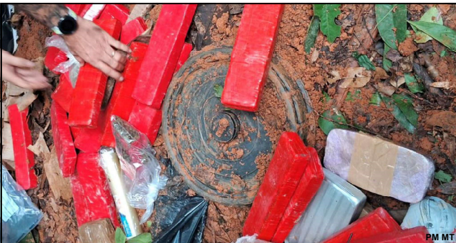
PM MT Quase 60 tabletes de maconha, cocaína e pasta base encontrados enterrados