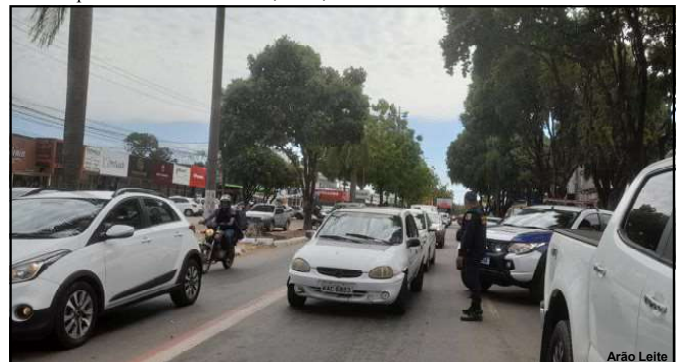
Motoristas devem ficar atentos ao calendário do Detran