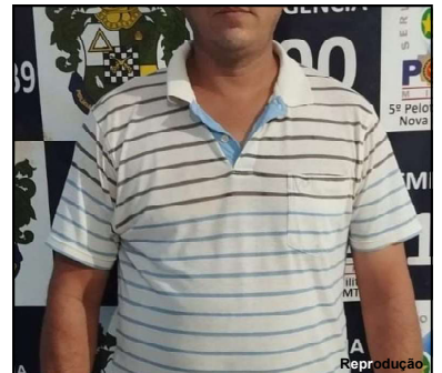
Reprodução Homem foi preso no Distrito de Japurana

efetuou a prisão do homem ao receber informação de que ele estaria no Distrito de Japurana, 30 KM do núcleo urbano do município. “O localizamos no endereço, apresentamos o