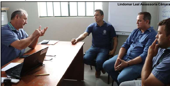
Presidente da Comov recebendo visita de vereador e secretário

E o parlamento estadual de Mato Grosso acaba de aprovar um Projeto de Lei que conforme estudos, poderá facilitar um desmatamento ainda maior no estado. Isso porque a matéria que passou por 15 votos favoráveis contra oito, autoriza o estado a reduzir reservas legais, ou seja, abre caminho para que a parte explorada ou desmatada seja maior.