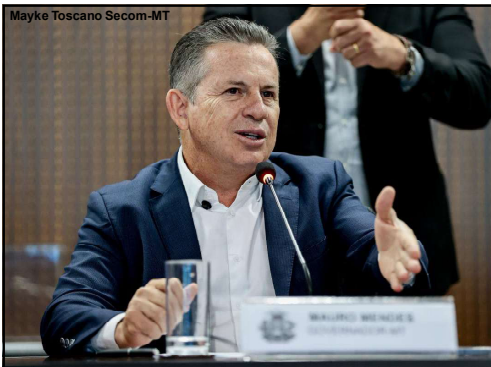
Governador sustenta que não deve haver regalias nas prisões