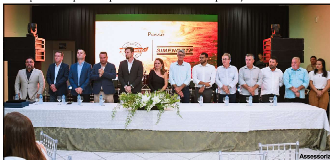
Evento marcado pela presença de autoridades do estado

Vereadores de Alta Floresta também marcaram presença no evento.