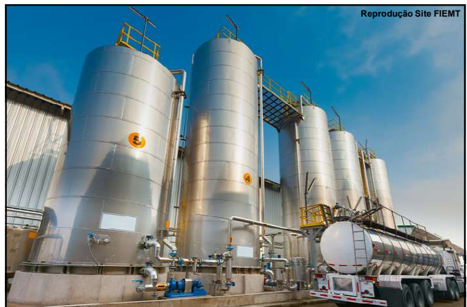
Aumento das indústrias proporciona ainda mais oportunidades de emprego no estado

O relatório ainda informou que o piloto estava com o certificado médico aeronáutico e a licença de piloto comercial em vigor. A maior parte do histórico operacional dele se desenvolveu na operação aeroagrícola. Entre setembro de 2012 e a data do acidente, o piloto acumulou mais de 3 mil horas de voo em diversos modelos de aeronaves agrícolas.