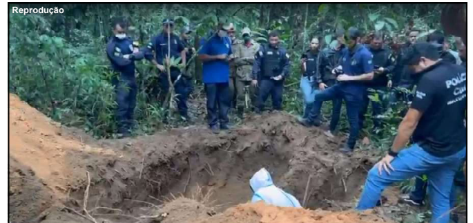
Corpos foram encontrados em grande sepultura em Lucas do Rio Verde

Josafá segundo o cabo dos bombeiros, disse que se alimentou com frutos que encontrou na floresta. “É uma área muito rica em vários tipos de frutos, palmitos e ele é mateiro. Apesar do cansaço, estava bem”, finalizou.