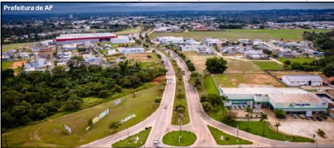
Município se torna cada dia mais uma das grandes potências do estado

Chikungunya: A chikungunya provoca febre e dores articulares intensas, muitas vezes persistindo por longos períodos, com sintomas que apresentam risco de se tornarem crônicos.