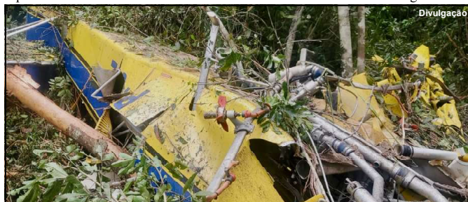
Tragédia na cidade de Vera matou homem de 42 anos