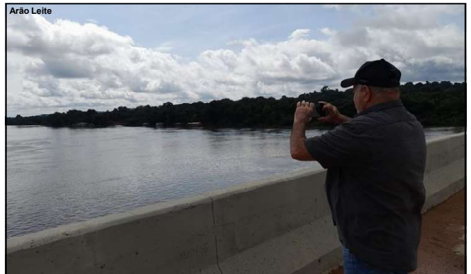
Vereador e voluntário registrando onde acontecerá a competição

“A primeira-dama está empenhada nessas parcerias, junto com a Assistência Social e nossa assessoria internacional, e vou trabalhar pessoalmente nisso também. Sabemos