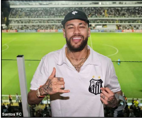
Neymar visitou a Vila Belmiro em 2024