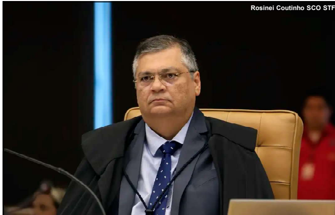
Decisão de Ministro Flávio Dino impacta o estado de MT

Os funcionários querem maior reajuste, os deputados negociam o percentual maior também, num reforço ao pedido dos servidores, mas Mauro Mendes se mostra irredutível quando a revisão. A sessão pode ser acompanhada ao vivo no plenário ou pelos canais da AL nas redes sociais. (GD)