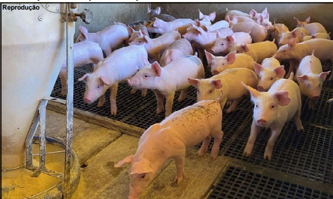
MT mostra novamente seu potencial, mas no cenário nacional o resultado também foi positivo