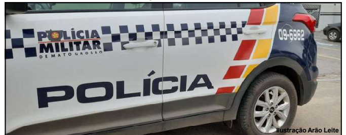
PM registrou acidente no domingo à tarde na Avenida Ariosto

A Polícia Militar também foi chamada para atender a ocorrência. Já o motorista de aplicativo, preocupado com a vítima, se deslocou até a unidade de médica onde ficou sabendo que os ferimentos não foram graves e que a vítima ficou aos cuidados médicos.