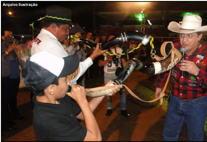
Evento é anunciado para o mês de aniversário de Alta Floresta

Lançamento oficial será nesta terça-feira, dia 28 de janeiro, no Teatro Agostinho Bizinoto