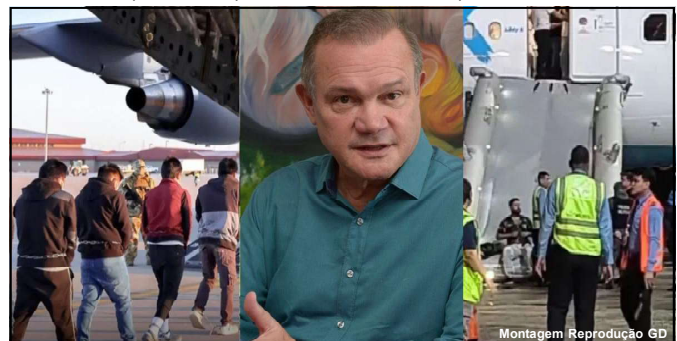
Senador analisa que EUA estão fazendo isto para que o resto do Mundo veja

O parlamentar ainda defendeu que o Brasil deveria adotar uma política mais rigorosa em relação às pessoas que vêm de outros países. “Teria que ter uma fiscalização mais rigorosa aqui também. Inclusive Roraima vive uma situação difícil porque acabam indo pra lá e vivem sofrimentos”, finalizou.