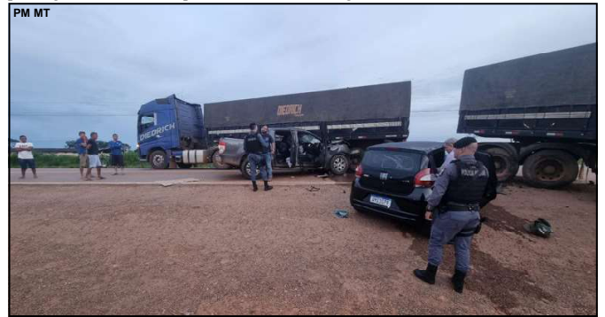
Carros com frentes destruídas em acidente na MT 208 em Carlinda