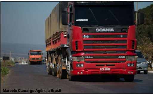
Marcelo Camargo Agência Brasil

Preço dos fretes poderá ser comparado ao do ano de 2023