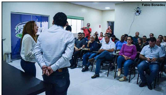
Orçamento do município discutido durante Audiência

toda a arrecadação do município, especialmente aos impostos municipais como IPTU, taxa de controle e fiscalização, entre outros. A audiência contou com presença de secretários e servidores públicos e comunidade.