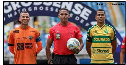
Cuiabá venceu o Sport Sinop 5x0

Na Arena Pantanal não houve surpresas na goleada do Cuiabá sobre o Sport Sinop por 5x0 e assumiu a vice liderança e classificação direta para a semifinal também. O Sport Sinop com uma campanha muito ruim nas primeiras rodadas, ainda conseguiu escapar do