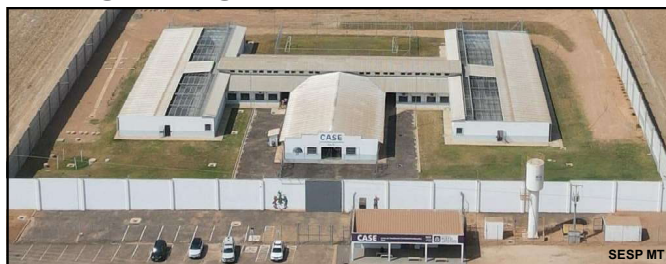
Centro Sócio Educativo na cidade de Sinop