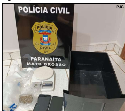
Material apreendido pela Polícia Civil em Paranaíta