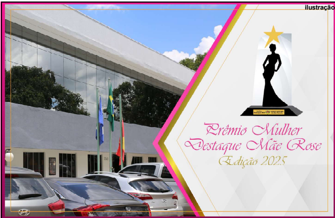
Prêmio ganhou nome de pioneira de Alta Floresta

O Prêmio Mulher Destaque Mãe Rose não apenas reconhece o mérito dessas mulheres. A concessão da honraria, por meio do Decreto Legislativo 540/2025, enaltece suas trajetórias e as coloca como exemplo de força e perseverança, sendo inspirações para futuras gerações.