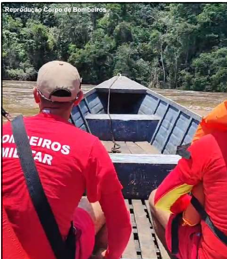
Militares durante buscas por desaparecido

Durante ação, militares percorreram pelo menos 50 Km de rio