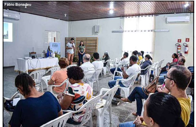
Evento realizado no município de Alta Floresta