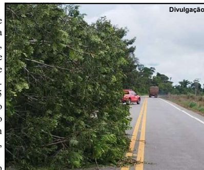
Devido à árvore caída, via ficou parcialmente bloqueada

O trânsito no local foi orientado e o trabalho durou aproximadamente 02h30.