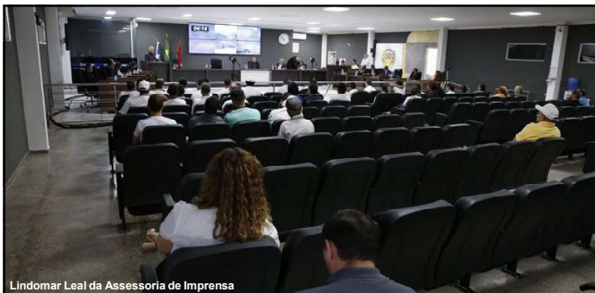
Lindomar Leal da Assessoria de Imprensa