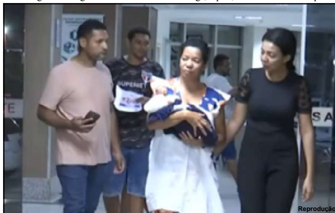
Criança que foi tirada do ventre da mãe assassinada ganha alta e deixa hospital com a avó