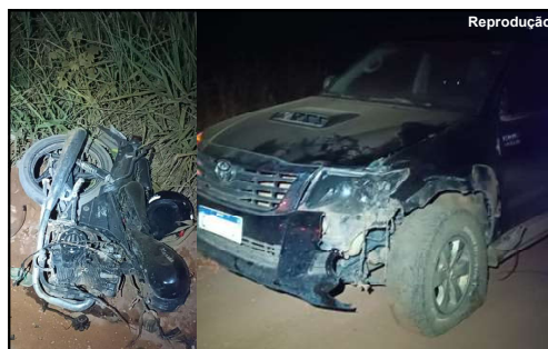
Danos provocados na frente da caminhonete e moto destruída

Um choque frontal e violento, envolvendo uma caminhonete Hilux e uma moto Dafra de 150 cilindradas deixou um homem de 37 anos e um menino de 13 anos com ferimentos graves. O fato aconteceu na noite de sábado na zona rural de Alta Floresta em setor de chácaras.