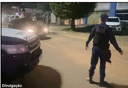
Agente de segurança durante Operação Lei Seca em Alta Floresta

Durante a operação 27 veículos recolhidos