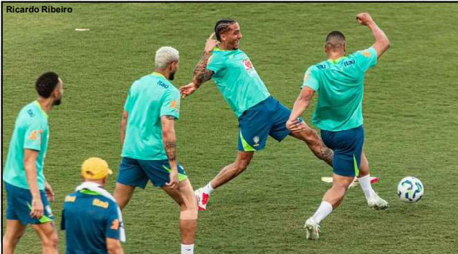
Seleção Treina para enfrentar a Colômbia

Brasil x Colombia 21:45h (horário de Brasília), no Mané Garrincha.