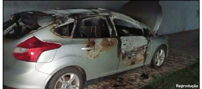
Carro ficou com danos de grande monta devido a incêndio criminoso

Quando ao ocorrido, a mulher é apontada de ter pulado o muro da casa do ex e ateadado fogo no carro da atual do homem com quem se relacionava. Já os bombeiros controlaram o incêndio e o caso no Setor J deverá ser encaminhado à Delegacia de Polícia Civil.