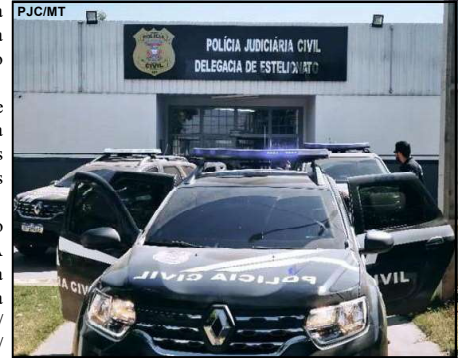
Alerta aos proprietários de veículos em MT

Conferir com atenção os dados bancários e