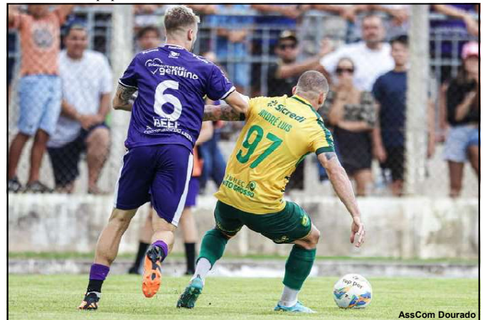
Cuiabá venceu primeiro jogo frente ao Primavera

O jogo de volta e decisivo será no dia 29 de março (sábado), a partir das 15h30, na Arena Pantanal. O Cuiabá pode até empatar e mesmo assim garantirá o pentacampeonato consecutivo. O Primavera precisa vencer por um gol de diferença para levar a disputa para os pênaltis, ou dois para buscar o título.