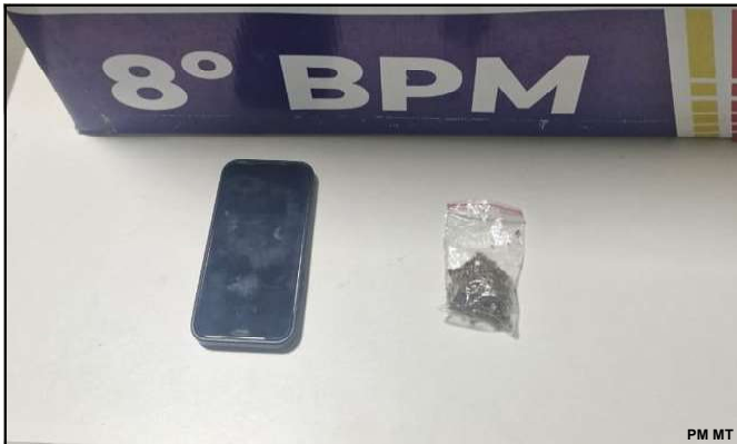
Maconha e celular apreendidos pela PM em AF

Suspeito detido foi encaminhado junto com a droga para a Delegacia de Polícia Civil