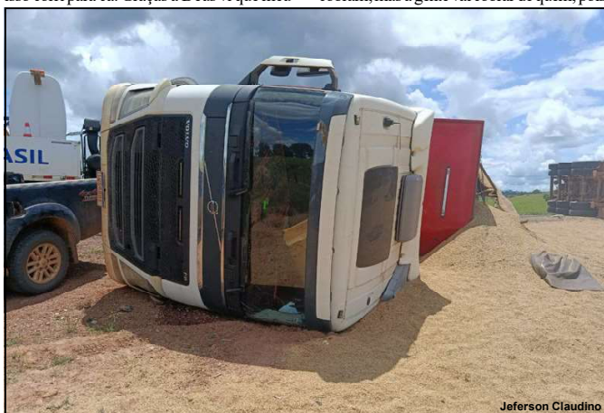
Carreta tombada na Rodovia MT-320 município de Carlinda

Para pessoas com comorbidades, a redução foi de 58,7%. Já para crianças pequenas e idosos a redução foi de 39% e 31,2% respectivamente.