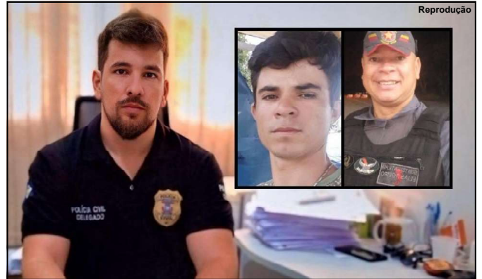
Delegado do caso falou a programa de TV ao vivo sobre prisão de oficial

O jovem foi detido e encaminhado à Delegacia de Polícia Civil.