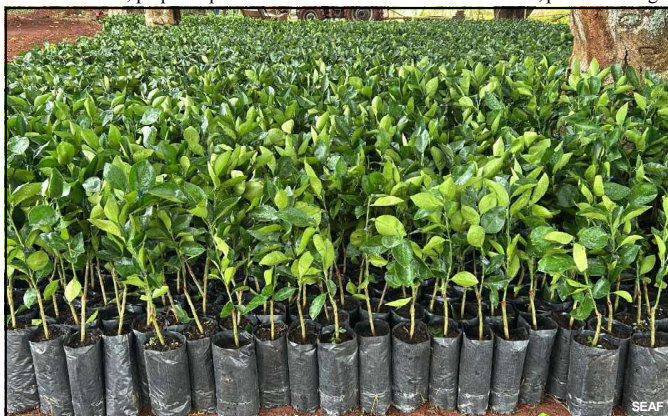
Mudas reforçarão produção de Mato Grosso

Essa parceria tem gerado muitos resultados positivos, que refletem de forma direta no bem-estar e qualidade de vida das famílias que são atendidas pelo município.