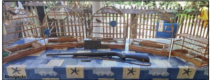
Arma e pássaros apreendidos com suspeito

Diante dos fatos, o homem foi detido e conduzido à delegacia e os itens apreendidos foram entregues à Polícia Civil para as devidas providências, sendo lavrados os devidos autos administrativos e o Boletim de ocorrência. Também foi aplicada uma multa no valor de R$ 2.000,00.