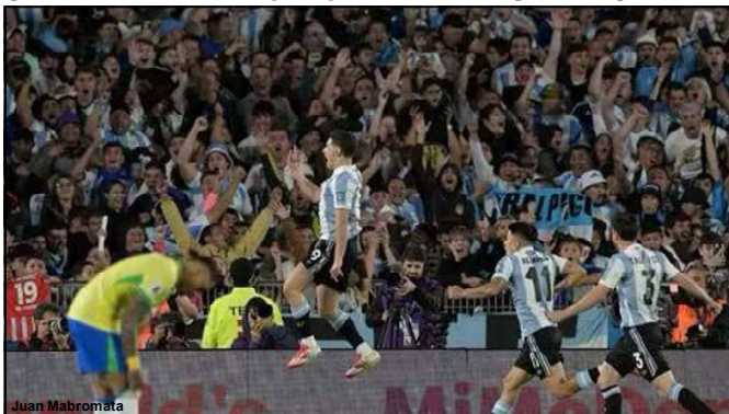
Álvarez comemora gol frente ao Brasil

O atacante Raphinha e o volante André estavam pendurados e foram advertidos com cartão amarelo. Eles não poderão enfrentar o Equador na próxima rodada das Eliminatórias. Em junho, o Brasil visita o Equador no dia 5/6 e depois recebe o Paraguai dia 10/6, em jogos ainda sem local definido.