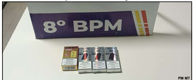
Material de comercialização proibida foi apreendido em tabacaria de AF

Um advogado da suspeita acompanhou o caso que agora deverá ser investigado.