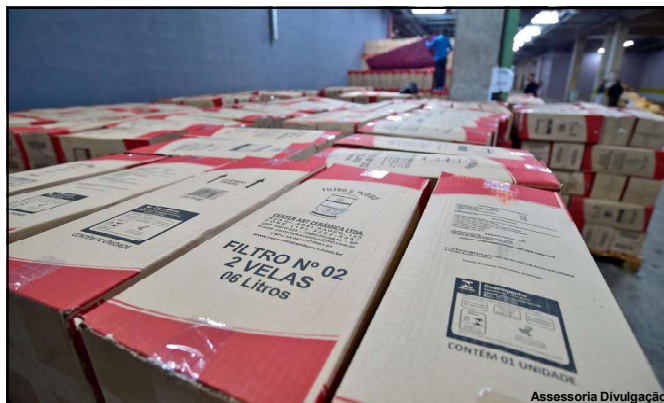
Filtros de barro foram encaminhados ao município para atender famílias menos favorecidas