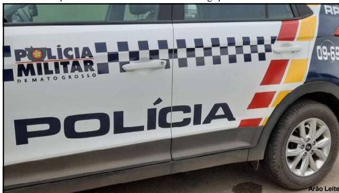
Polícia Militar foi acionada para registrar o caso

O caso foi encaminhado para investigação da Polícia Civil.