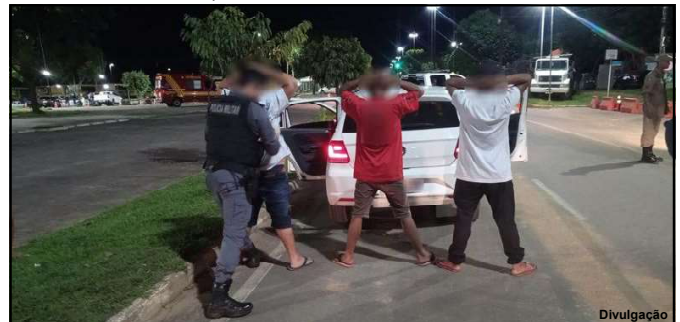
Abordagem durante Operação em Alta Floresta

Ao todo foram emitidos 87 autos de infração, foram removidos 32 veículos, sendo 06 carros e 26 motos.