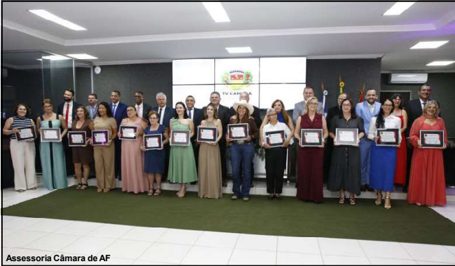
Assessoria Câmara de AF

Essas mulheres foram reconhecidas por suas contribuições notáveis, seja na liderança comunitária, na educação, na saúde, nas artes, ou em ações voluntárias que impactam diretamente a vida da população de Alta Floresta. Cada uma delas, com suas histórias de superação, se torna um exemplo de força, dedicação e empoderamento feminino.