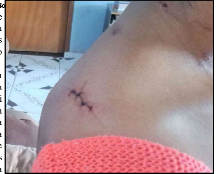
Corte provocado por arma branca, segundo a vítima

A mulher nesta segunda-feira se mantinha em local não sabido com medo do suspeito que desapareceu após crime