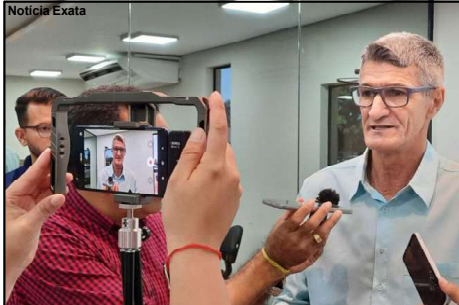
Próprio prefeito anunciou notificação judicial na sexta-feira através de rede social