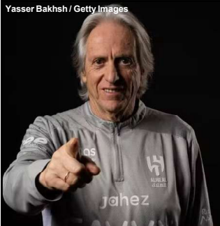
Jorge Jesus pode ser novo técnico da CBF