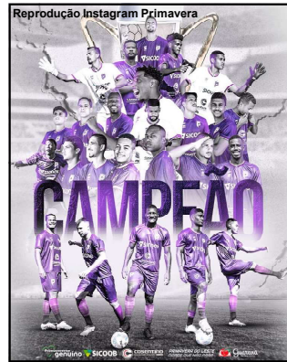
Primavera conquista título estadual