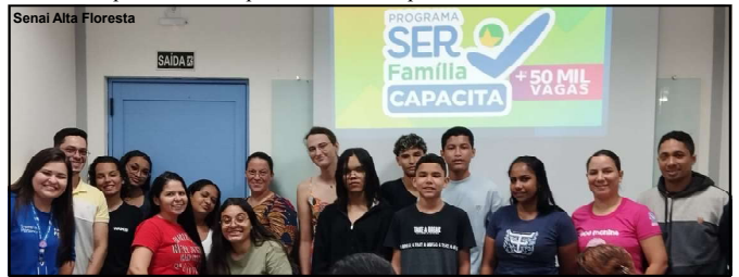
Moradores de Alta Floresta ganham oportunidade de capacitação ao mercado de trabalho