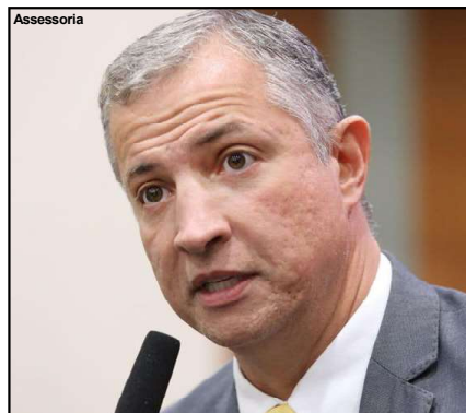
Parlamentar não concorda com o contrato firmado entre o estado e concessionária

O 4º Termo Aditivo ao contrato é um dos principais pontos de contestação. De acordo com a denúncia, esse aditivo, sob a justificativa de reequilíbrio econômico-financeiro, reduziu a outorga variável de 1% da receita tarifária bruta para 0%. Além disso, suprimiu obras estruturais fundamentais, como a pavimentação