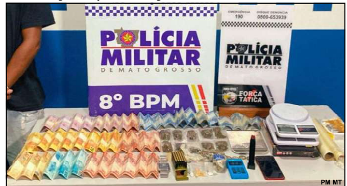
Droga apreendida estava na casa e carro do suspeito

Após prisão no início da noite de terça-feira o sujeito foi encaminhado à Delegacia de Polícia Civil de onde levado à Cadeia Pública de AF.