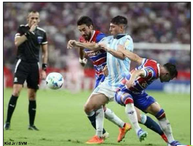
Kid Jr / SVM