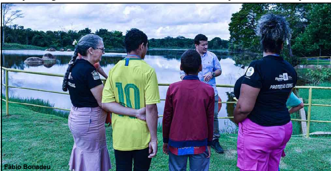
Momento muito apreciado pelas crianças atendidas em Alta Floresta

Essa é uma excelente oportunidade para quem busca capacitação profissional e novas oportunidades no mercado de trabalho. Os cursos fazem parte do Programa Ser Família Capacita, desenvolvido pela Secretaria de Estado de Assistência Social e Cidadania, com o apoio da Prefeitura de Alta Floresta.