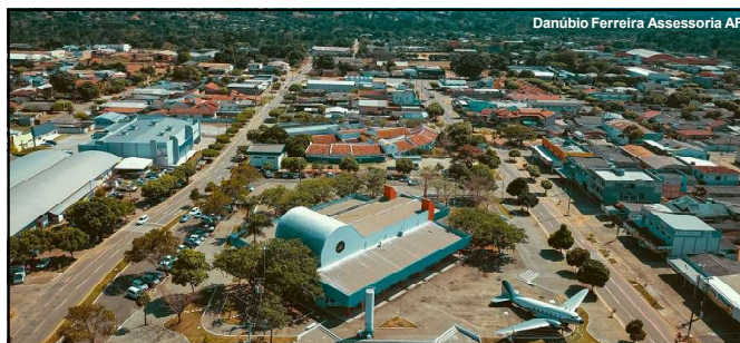
Danúbio Ferreira Assessoria AF

Município faz chamamento para nova seleção de famílias