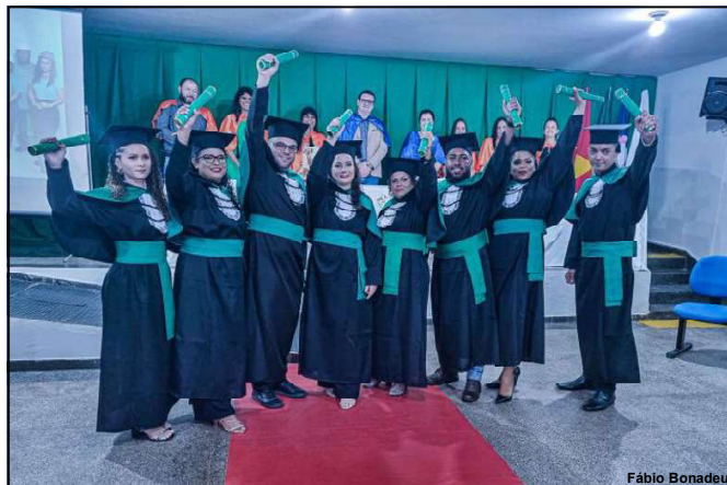
Cerimônia de conclusão do curso de técnico de segurança do trabalho