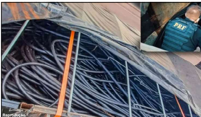
Ação da PRF apreendeu cobre furtado em AF

Pelo menos uma pessoa foi conduzida e o material poderá ser resgatado por empresa