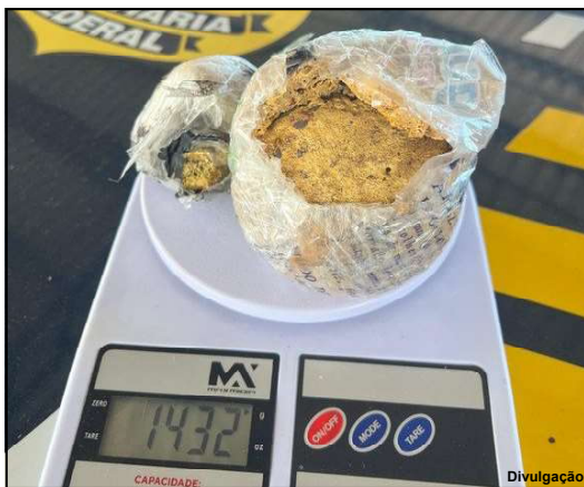
Minério foi apreendido em Pontes e Lacerda