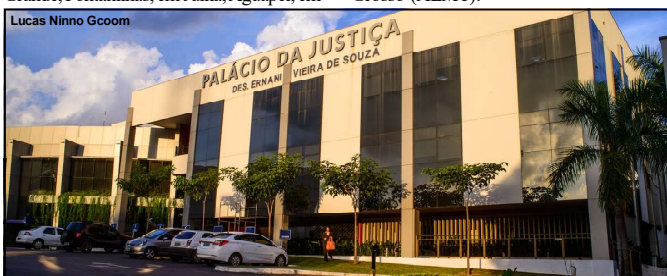
Projeto do Tribunal de Justiça aponta possibilidade de extinção em MT

A proposta de fechamento das unidades já foi aprovada pelo Pleno do TJMT e aguarda a manifestação do CNJ. Se aprovado na instância superior, a proposta será encaminhada para a análise dos deputados estaduais na Assembleia Legislativa de Mato Grosso (ALMT).