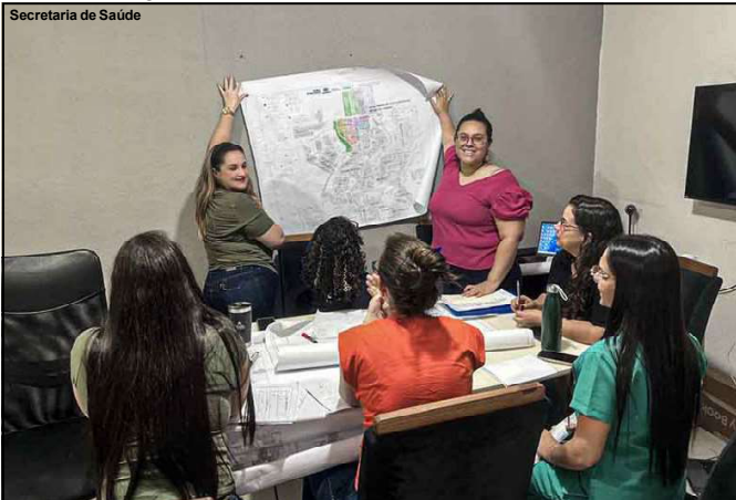
Secretaria trabalha para melhorar atendimento principalmente nos novos loteamentos