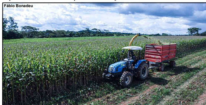
Cada dia que passa aumenta número de produtores atendidos em Alta Floresta

No Estado de Mato Grosso, especialmente no município de Alta Floresta, o período de estiagem compreende o intervalo entre meados de maio e meados de setembro. No entanto, é comum, por volta de agosto, a ocorrência de uma chuva esporádica, popularmente conhecida como “chuva do caju”.