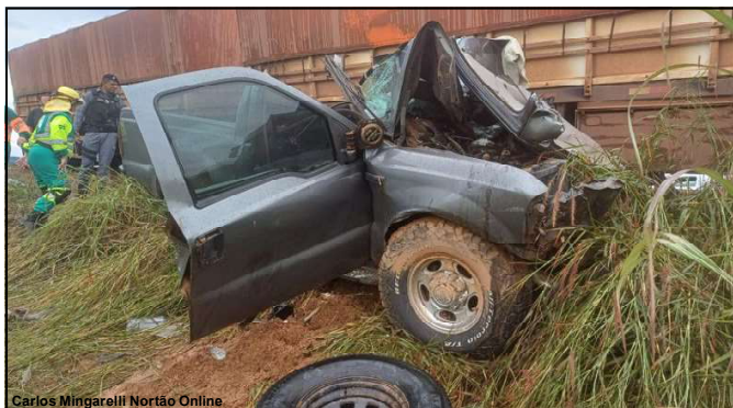
Mais uma tragédia em estrada de Mato Grosso