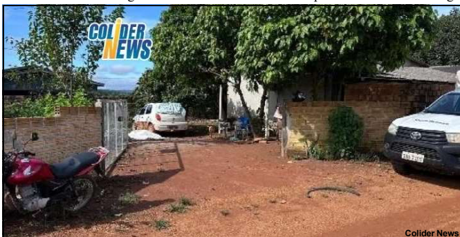
Rapaz foi morto no final de semana na cidade de Colíder em frente a uma fábrica de sofá

e motivação do crime contra o jovem que também tinha diversas passagens criminais.