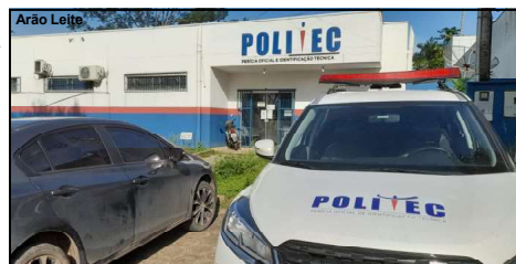
Corpo de trabalhador de fazenda foi encaminhado à Politec em AF

Ao buscar mais informações os policiais militares logo souberam que no sábado à noite, em um bar próximo, a vítima ficou tomando cervejas com um casal. "A testemunha disse que o conheceu aquele dia, ficaram tomando