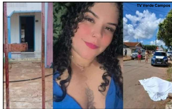
Vítima ainda saiu da casa tentando pedir ajuda, mas caiu perto da calçada vizinha

A polícia foi acionada assim que populares encontraram a vítima caída na rua, após ser esfaqueada pelo suspeito.