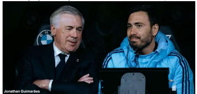
Ancelotti continua como plano A da CBF