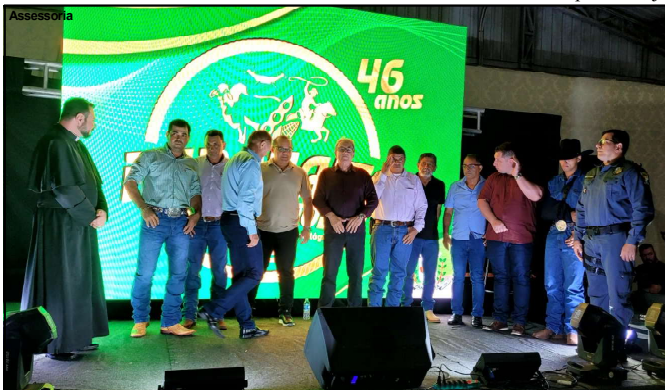
Cerimônia de Lançamento da Paranaíta Expo Show