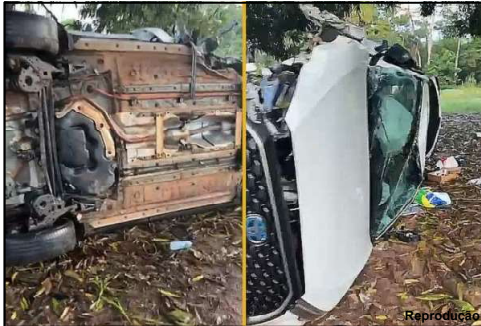
Carro destruído em acidente na Perimetral em Alta Floresta

Alta Floresta – Mais de três horas da manhã quando o Corpo de Bombeiros em Alta Floresta foi acionado para atender uma ocorrência de capotamento. No local, Perimetral Rogério Silva, curva próxima do Campus II da Unemat, uma Corolla Cross capotado e três jovens ali. Duas eram menores e segundo informações, a condutora tem 17 anos. A maior de idade, 25 anos, foi encaminhado ao Pronto Atendimento Municipal.