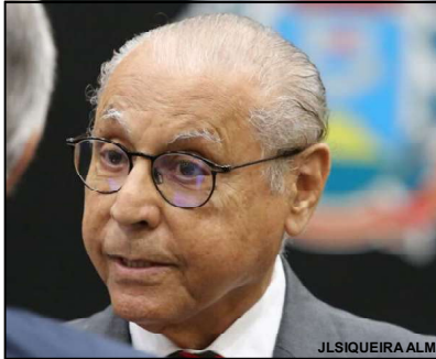
Parlamentar disparou contra empresas que fazem empréstimos a servidores do estado

"Ao contratar um empréstimo de R$ 10 mil, sem ter acesso ao contrato, o servidor não sabe quantas parcelas, o