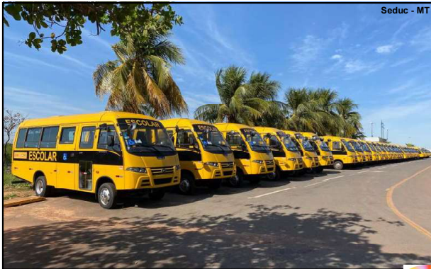
Seduc - MT

Prefeitura de Alta Floresta deve investir mais de R$ 11 milhões na aquisição de novos ônibus escolares