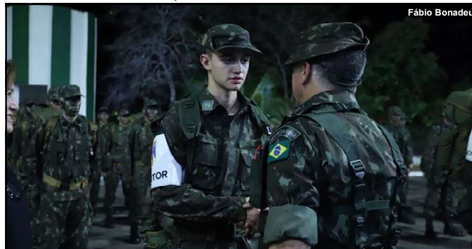
O evento também marcou o Dia da Arma de Infantaria

da juventude de Alta Floresta, fortalecendo os laços entre a instituição militar, a comunidade e os exemplos positivos da sociedade local.