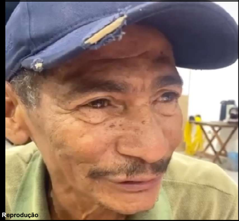
Piauí tinha 60 anos e assassino o matou para roubar

Dois autores do crime foram presos e agora responderão por latrocínio