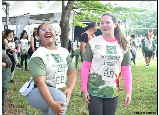
Milhares de pessoas participaram e destacaram edição 2025 do evento em AF