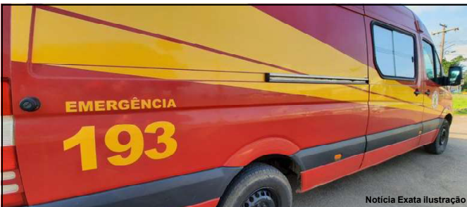
Notícia Exata Ilustração

Ação do Corpo de Bombeiros foi domingo no setor industrial do Cidade Alta