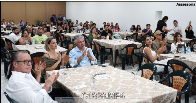
Lançamento do evento na noite de sexta-feira

Na ocasião, a deputada fez a seguinte declaração: “O Baleia vem agora em agosto, para acompanhar as convenções do Diretório Estadual do MDB aqui em Mato Grosso. Com certeza até lá ele já vai ter informações quanto as pré-definições, porque eu acredito que por conta do prazo, que é um ano antes do período eleitoral, essa discussão em agosto já vai estar muito mais clara pra todos nós”. (Gazeta Digital)