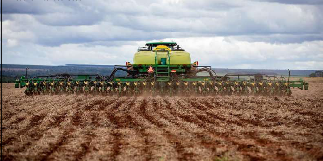
O principal motor do desempenho de Mato Grosso acima da média nacional é a agropecuária