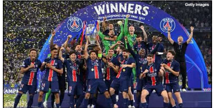
Marquinhos (ao centro) levanta a taça da Liga dos Campeões

O PSG agora entra para a prateleira de campeões da Europa e pode abrir um novo horizonte no futuro do clube.