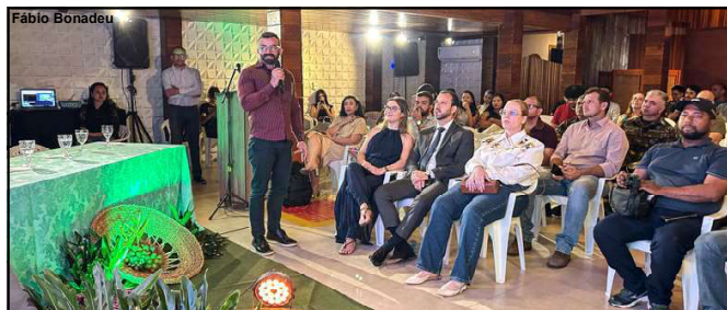
Encontro em AF foi realizado no Espaço de Eventos do Simenorte