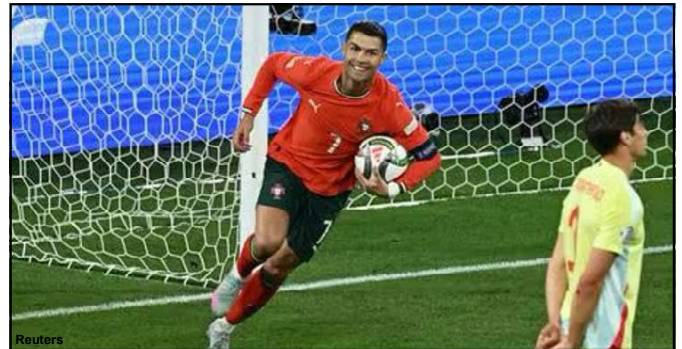
Cristiano Ronaldo fez o gol de empate da final

EM ALTA FLORESTA, PRECISOU DA POLÍCIA MILITAR, LIGUE: