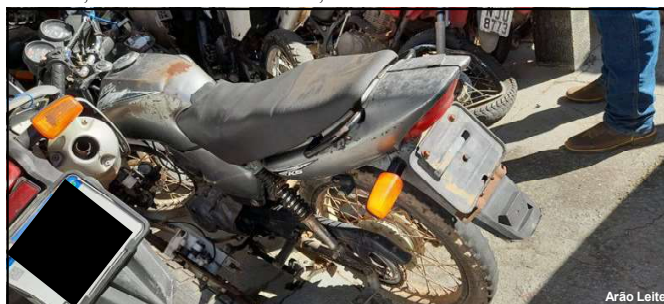
Veículo localizado foi furtado na frente de hospital em 2003