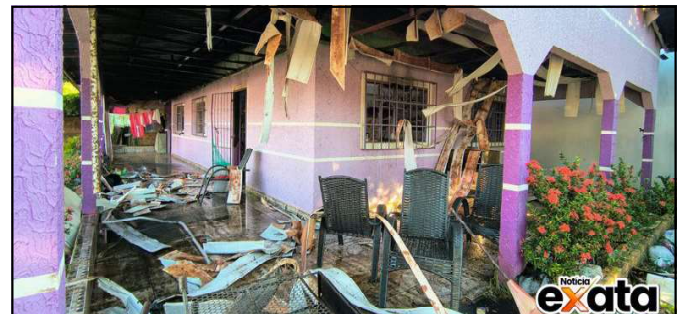
Bombeiros apagam incêndio, mas fogo criminoso deixou rastro de prejuízo

Corpo de Bombeiros que já tinha socorrido a vítima, precisou agir rápido para não deixar que toda a casa fosse consumida pelas chamas, mas o fogo que teria iniciado na sala, acabou controlado.