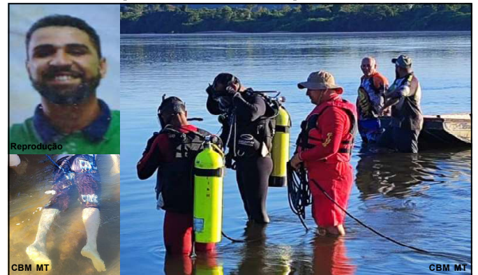
Bombeiros resgataram corpo a poucos metros do local do afogamento

O caso deverá ser investigado pela Divisão de Homicídios.