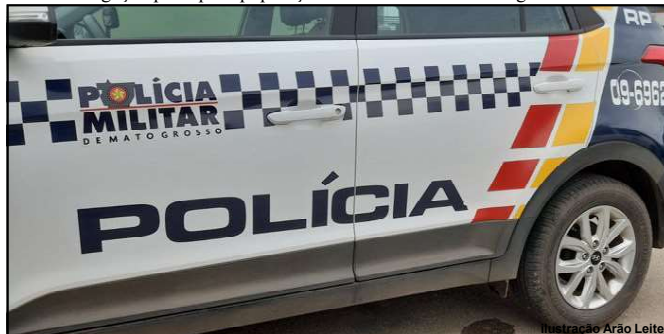
Polícia Militar identificou infratores e recuperou veículos

A Polícia iniciou rondas, localizando duas motocicletas dentro do antigo zoológico de Alta Floresta, escondidas dentro do mata, próximas à residência do suspeito, sendo as que haviam sido levadas do pátio da Secretaria de Trânsito de Alta Floresta, as motos, uma CG 125 Fan KS de cor preta e uma XRE 300 de cor preta foram recolhidas e encaminhadas à Delegacia.