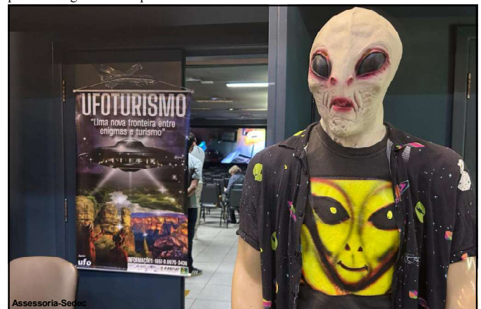
Barra do Garças vem se consolidando como um dos principais destinos de ufoturismo no Brasil