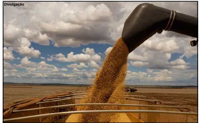
Produção do estado só aumenta cada vez mais

“O bom resultado é justificado pela utilização crescente de tecnologia pelos produtores, aliada às boas condições climáticas na maioria das regiões produtoras”, destaca a Conab.