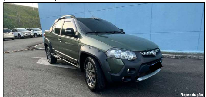
Carro oferecido pelo golpista à produtores de Carlinda