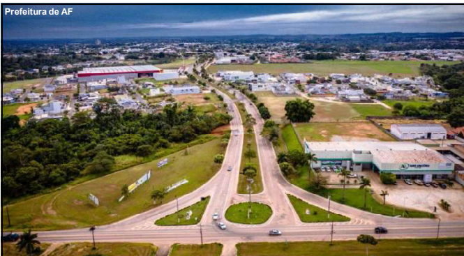
Mais uma obra para melhorar infraestrutura do município