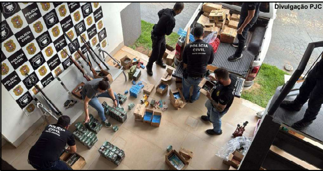
Polícia Civil fez cerco e operação resultou em grande apreensão

“O material apreendido na operação, incluindo os aparelhos celulares dos principais alvos, foram encaminhados para a perícia, com o fim de levantar novas informações, que possam levar a outros possíveis envolvidos, assim como outros crimes praticados pelo grupo criminoso”, disse a delegada.