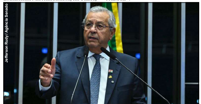
Senador Jayme Campos fala em monopólio e dispara contra empresa

A decisão foi proferida em sessão realizada em 4 de junho de 2025, em Cuiabá, e já está disponível no Diário da Justiça Eletrônico do Tribunal.