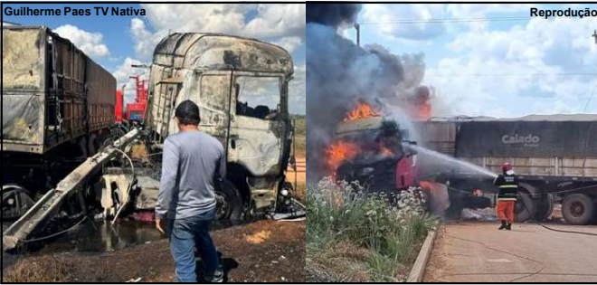
Após incêndio, o que sobrou do caminhão

A batida no poste foi violenta e o motorista logo saiu do caminhão que começou a pegar