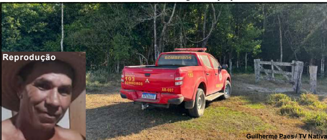
Bombeiros fazem busca em área onde desaparecido teria entrado

Enquanto isso, familiares, mesmo cansados, estão acompanhando as buscas, querendo notícias do paradeiro de Edson que saiu de casa para o trabalho e após ter chegado na propriedade rural.