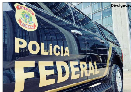
Há vagas para delegado, escrivão, perito, investigador e papiloscopista

Para concorrer às vagas reservadas a pessoas negras, o candidato deverá, no ato da inscrição, optar por concorrer às vagas reservadas às pessoas negras (20% para cada cargo ou área) e se autodeclarar negro, conforme quesito cor ou raça adotado pelo Instituto Brasileiro de