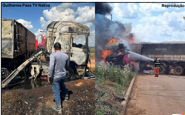
Guilherme Paes TV Nativa

Bombeiros foram acionados e evitaram destruição total do veículo