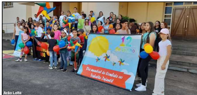
Encerramento do evento foi em frente à Igreja Matriz de AF

O valor estimado para a obra é de R$ 2.030.706,89 (Dois milhões, trinta mil, setecentos e seis reais e oitenta e nove centavos), para pavimentar 9.122,01 m 2 , o recurso é oriundo de convênio com a Caixa Econômica.