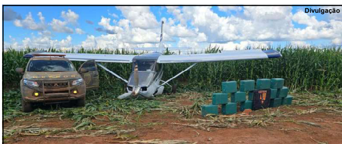
Cerco ao tráfico tem gerado grande prejuízo a criminosos

Informação é apontada pelo Mapa da Segurança Pública