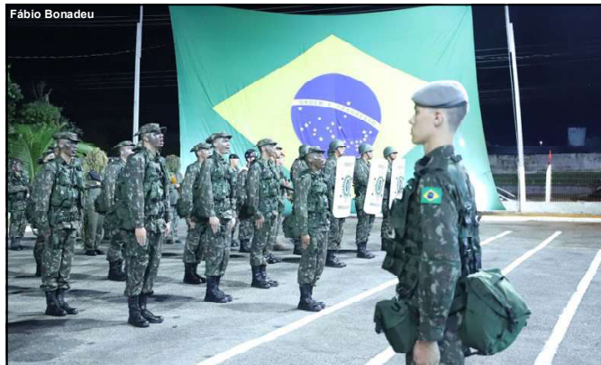
O alistamento é para todos os brasileiros do sexo masculino que completam 18 anos até 31 de dezembro