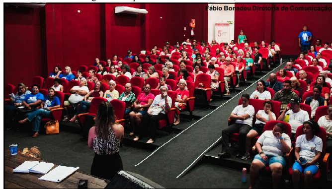
Evento realizado no município de Alta Floresta

Ele ainda acrescentou: “Tentamos de tudo, mas a conclusão foi de que a própria secretaria teria capacidade de gerir a política mineral no estado”, finalizou Miranda.