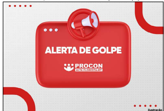
Estelionatários estão se passando por órgão para levar vantagem financeira

da população em instituições reconhecidas. Atenção e cuidado ao lidar com comunicações digitais são essenciais para evitar prejuízos.