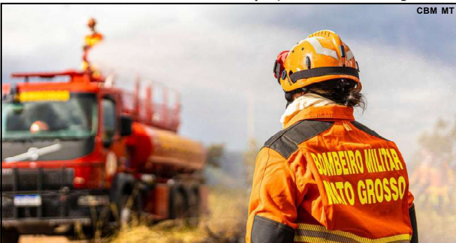
Período crítico vai começar e o estado prepara seus agentes para ações de combate

Na sessão Ordinária da Câmara nesta segunda-feira, 23 de junho, em