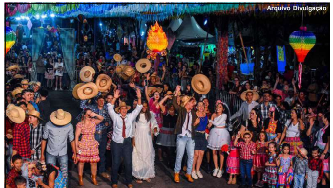
Evento promete reunir milhares de pessoas na Praça da Cultura