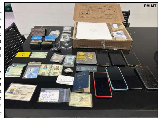
Documentos e objetos apreendidos pela PM

“Foi pedido apoio, temendo que houvesse algum grupo armado com vítimas dentro da residência. E quando a pessoa saiu, foi nervosa, não falando coisa com coisa, nossas equipes decidiram entrar e abordar. Mas não havia assalto. Por outro lado, encontramos vasto material para montagem de garimpo.