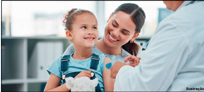
Famílias podem procurar todos os postos de vacinação que tem doses disponíveis