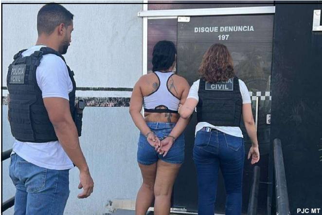
Mulher era alvo maior de operação da Polícia Civil

Foram conduzidas seis pessoas, entre 25 e 53 anos de idade. “Tudo indica que estavam se estruturando para construir novamente as balsas. Não estamos aqui para prender trabalhador, mas coibir o crime ambiental”, declarou o oficial.