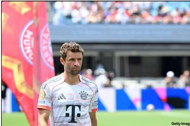
Thomas Müller em campo para Benfica x Bayern de Munique

é válida pelas oitavas de final da Copa do Mundo de Clubes. Caso avance, o time alemão terá pela frente Paris Saint-Germain ou Inter Miami.