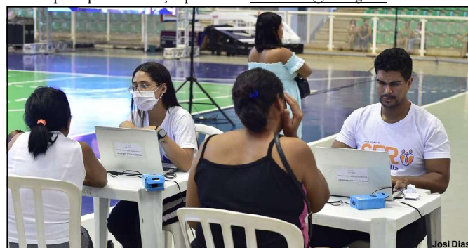
A ação será realizada simultaneamente em todos os municípios de Mato Grosso, em parceria com as prefeituras

A participação popular é essencial para a construção de um planejamento eficaz, democrático e voltado às reais necessidades do município.