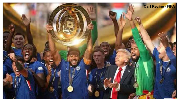
Carl Racine - FIFA