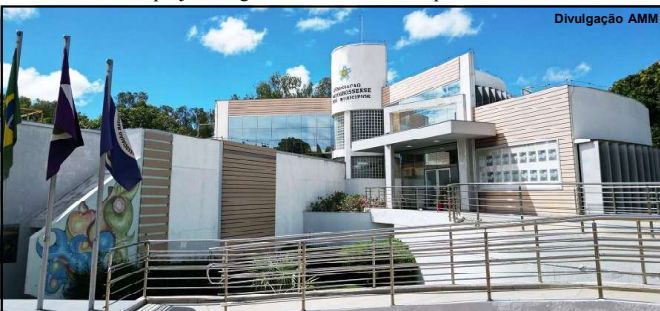
Nos próximos dias 16 e 17 o evento da AMM será em Juína

Falsas verdadeiras Uma ocorrência policial registrada final