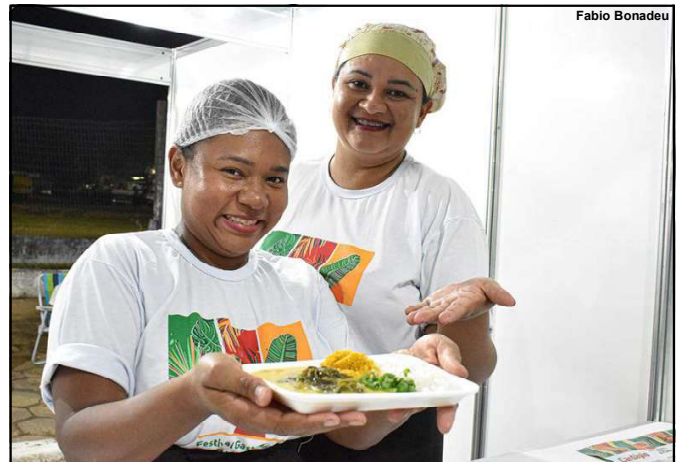
Pratos com os mais variados sabores da Amazônia foram apresentados e degustados em AF

visibilidade. As redes sociais mostram o quanto nossa gastronomia é rica. Temos um potencial enorme no turismo gastronômico, e o Festival evidencia isso", concluiu.