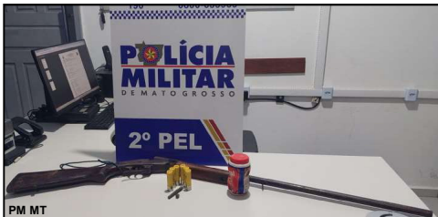
Espingarda com numeração prejudicada foi apreendida pela PM em Nova Monte Verde

Alta Floresta – Um homem foi preso pela Polícia Militar em São José do Apuy, acusado de porte ilegal de arma de fogo. Com o sujeito a polícia apreendeu uma espingarda calibre 20 com numeração prejudicada.