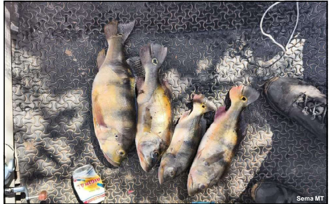
Espécie Tucunare apreendida durante operação no Cristalino

A Polícia Militar também aumentou em 21% as prisões relacionadas ao tráfico de entorpecentes. Nos primeiros seis meses deste ano, 5.022 pessoas foram conduzidas pela PM, enquanto 4.143 foram presas no ano passado.