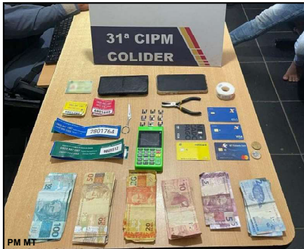
Material apreendido com casal acusado de golpe em Colíder

Pelo que foi apurado, os suspeitos encontrados com máquinas de cartão, números de telefones falsos, adesivos, dinheiro em espécie, celulares e os chamados grampos que são conhecidos como chupa cabra, estariam abordando pessoas e também colocando suas armadilhas nos caixas eletrônicos para que as pessoas tivessem dificuldade em sacar