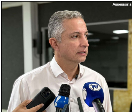
Deputado estadual Faissal Cail, do Cidadania