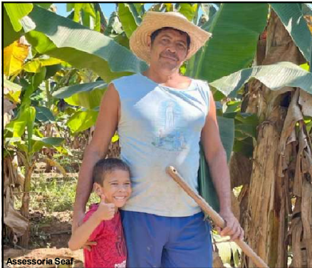
Produtor de pequena escala selecionado para exame

No Brasil, apenas seis estados adotam notificação compulsória da doença fúngica que afeta trabalhadores rurais