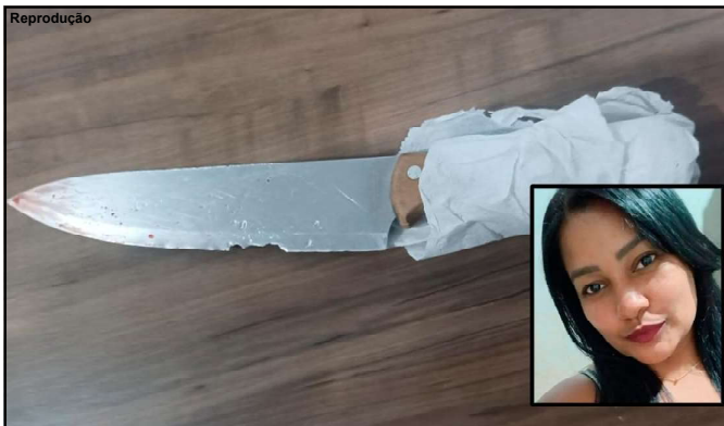
Faca usada para matar mulher (detalhe) de 28 anos