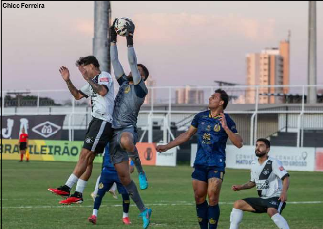
Mixto e Aparecidense empataram por 0x0

AGRICOLA CACHIMBO – VALE DO OURO PRODUTOS AGROPECUÁRIOS LTDA