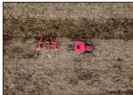
Apoio do município de AF tem sido de fundamental importância aos produtores