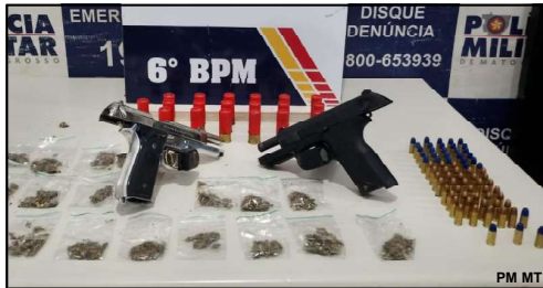
Pistolas apreendidas entre outros produtos ilícitos na cidade de Cáceres

Durante buscas na residência, foram encontradas mais 19 munições calibre .12 e 28 munições calibre .9mm. Questionados sobre o material encontrado, os adolescentes relataram ser membros de uma facção criminosa e não