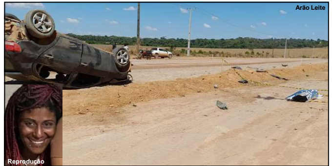
cenário da tragédia na MT-325 onde carro com cinco ocupante capotou, com quatro feridos sendo socorridos e uma mulher morrendo no local

Ele foi preso e a vítima encaminhada a uma unidade médica. Já a esposa enciumada deixou o local antes da chegada da PM.