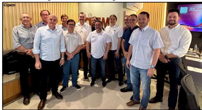
Eleição aconteceu na capital do estado

Em tempo: nas redes sociais, WF faz campanha sistemática contra o STF, em constante adulação ao ex-presidente.