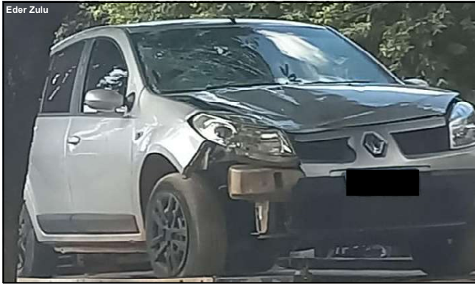
Sandero de aplicativo teve danos de média monta na frente