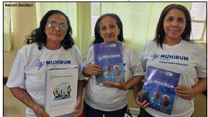
Irmas participam do projeto Muxirum no região Central de Cuiabá

O nome Muxirum Digital faz referência ao projeto da Secretaria de Estado de Educação (Seduc) para alfabetização de adultos.