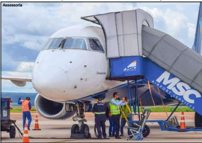
Voos de Azul tiveram aumento de passageiros em Alta Floresta

Todos esses procedimentos passam a ser processados de forma integral no ambiente digital da PF, como parte do processo de transição de competências anteriormente atribuídas ao Exército Brasileiro. A migração teve início em 1º de julho de 2025 e está sendo realizada de forma gradual.