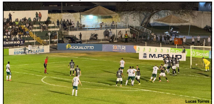
LEC empata em casa pela Série D

Luverdense empatou com Rio Branco-ES em casa em Lucas do Rio Verde. As equipes se encontram novamente no próximo sábado (9), no estádio Kléber Andrade, em Cariacica, no Espírito Santo.