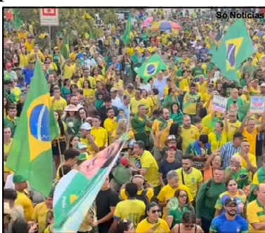
População lotou as ruas em manifestação pró Bolsonaro

Em Sorriso, também há movimentação em favor do ex-presidente, na avenida Blumenau.