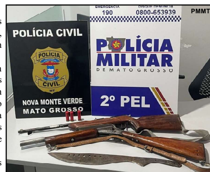
Prisão em flagrante por armas ilegais

Após a abordagem, o suspeito autorizou a entrada dos policiais em sua residência. Durante a busca no interior do imóvel, foram localizadas e