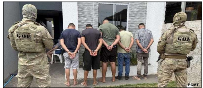
Trabalho integrado da polícia resultou em ação rápida

Participaram das ações equipes da Coordenadoria de Operações e Recursos Especiais (Core), Gerência de Combate ao Crime Organizado (GCCO), das Delegacias da Regional de Tangará da Serra, Diretoria de Inteligência, com apoio essencial do Centro Integrado de Operações Áreas (Ciopaer) e da Polícia Civil de Rondônia.