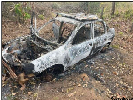
Veículo localizado totalmente queimado

Ela havia estacionado no pátio do posto, próximo à entrada do parque de