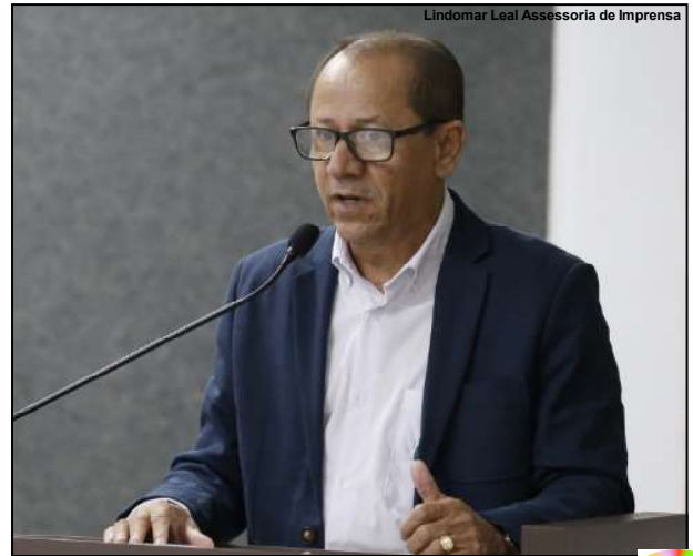
Lindomar Leal Assessoria de Imprensa