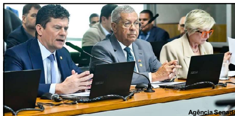
Senadores Jayme Campos e Margareth assinam impeachment de Alexandre de Moraes

por ele, principalmente contra o ex-presidente Jair Bolsonaro e diversos cidadãos brasileiros, ultrapassaram os limites constitucionais e democráticos. Minha posição é clara: estou e sempre estarei ao lado do povo brasileiro. Não defendo ideologias ou interesses pessoais, mas sim os princípios da justiça, da liberdade e do respeito à Constituição”, afirmou Jayme. “O Brasil precisa retomar o equilíbrio entre os poderes, e é por isso que assumo com