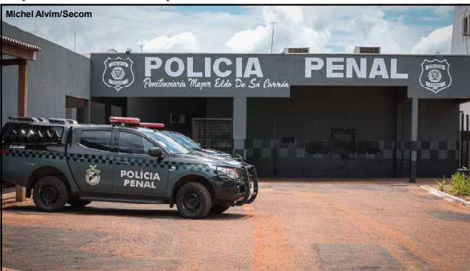
Sistema Penitenciário com metas

Incentivado por um grupo de empresários e lideranças políticas do Médio-Norte, o ex-prefeito por quatro vezes de Nova Mutum, Adriano Pivetta, só poderá ser candidato a deputado estadual, como deseja, se o irmão Otaviano Pivetta, hoje vice-governador, não assumir de vez o cargo de chefe do Executivo estadual. Os irmãos Pivetta são do Republicanos. Mas, como a tendência é de Mauro Mendes renunciar ao mandato até 4 de abril (seis meses antes do pleito) para disputar o Senado, o que tornaria Pivetta governador e, por tabela, candidato à reeleição, Adriano ficaria impedido de disputar as eleições de 2026. Ele se enquadraria na inelegibilidade reflexa, que impede o cônjuge e parentes de até segundo grau do chefe do Executivo de se candidatar a cargo eletivo.