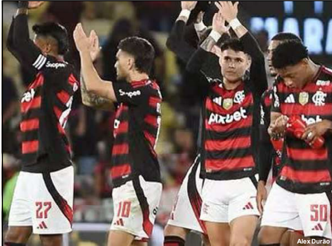
Jogadores do Flamengo atrevem apoio

valente do clube que fez sua estreia histórica em jogos oficiais no Maracanã.