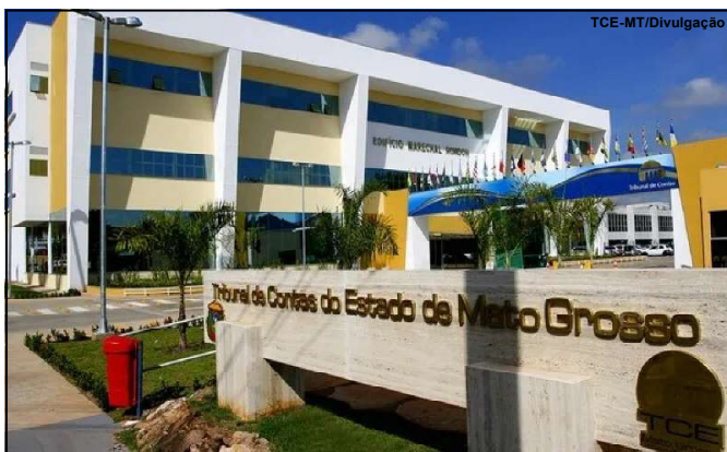
Nova Lei de Licitações

Tribunal de Contas de Mato Grosso reforça que municípios devem priorizar servidores efetivos para cargos ligados à Lei nº 14.133, com exceções justificadas