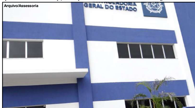
Após 12 anos estado se consolida como referência nacional

O relator ressaltou que essa interpretação visa preservar a segurança jurídica e a impessoalidade na gestão pública, além de garantir o cumprimento da legislação sobre contratações públicas. O parecer seguiu a recomendação do Ministério Público de Contas (MPC) e da Comissão Permanente de Normas, Jurisprudência e Consensualismo (CPNJur), sendo aprovado por unanimidade pelo Plenário.